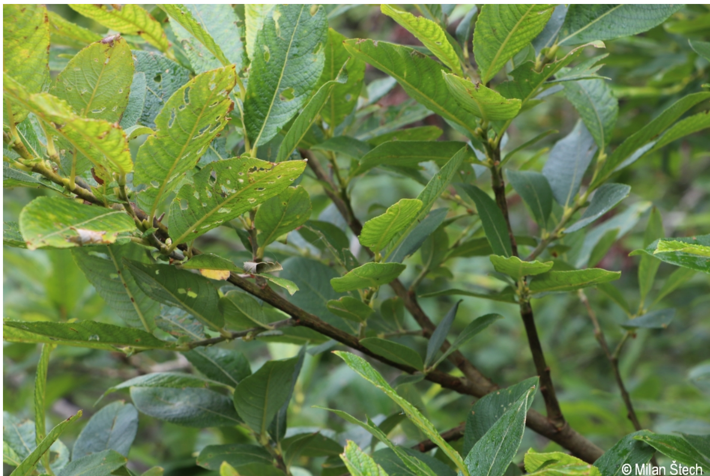
Salix appendiculata – Milan Štech – Velký Javor.