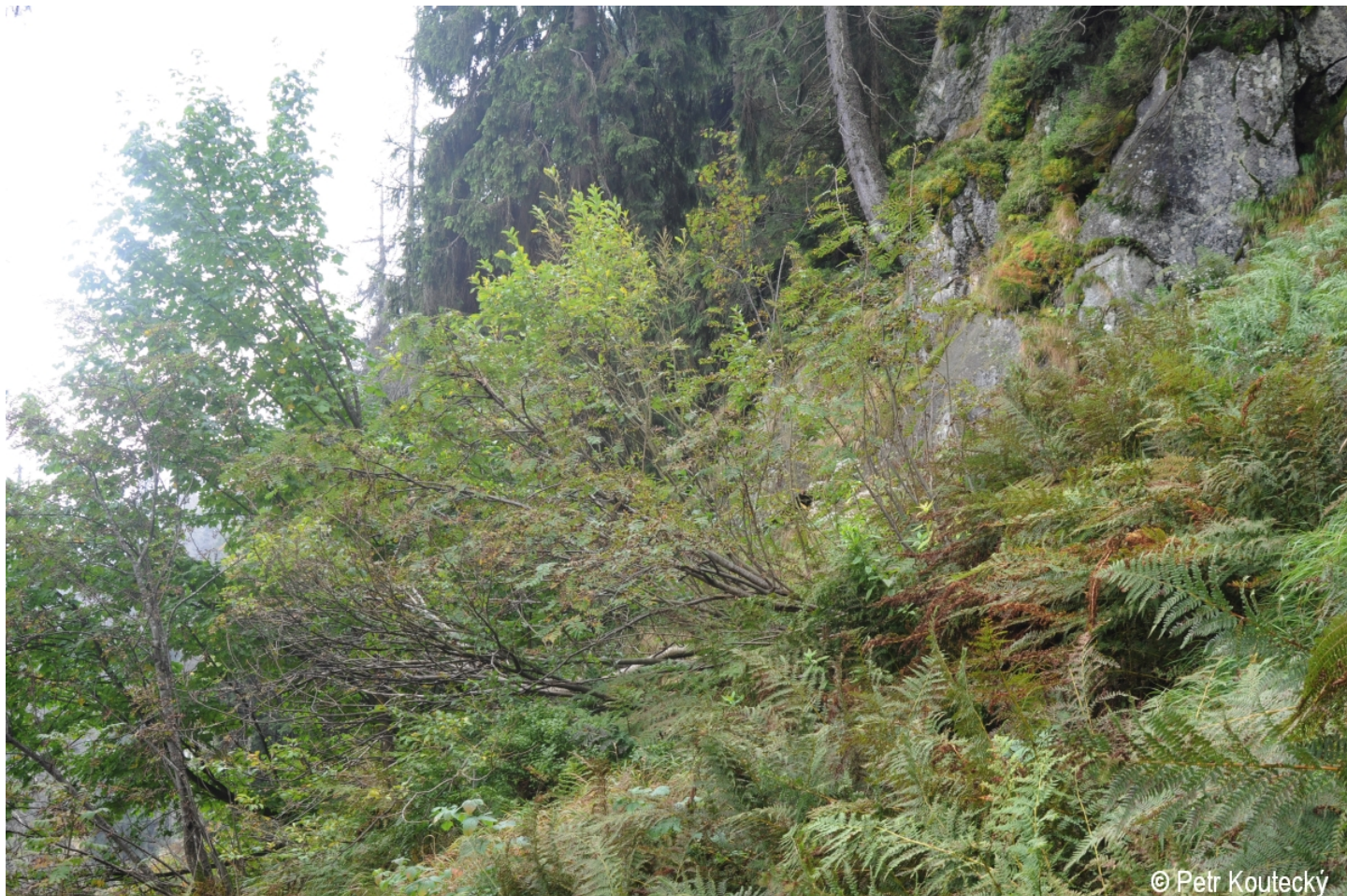
Salix appendiculata – Petr Koutecký – Plešné jezero.