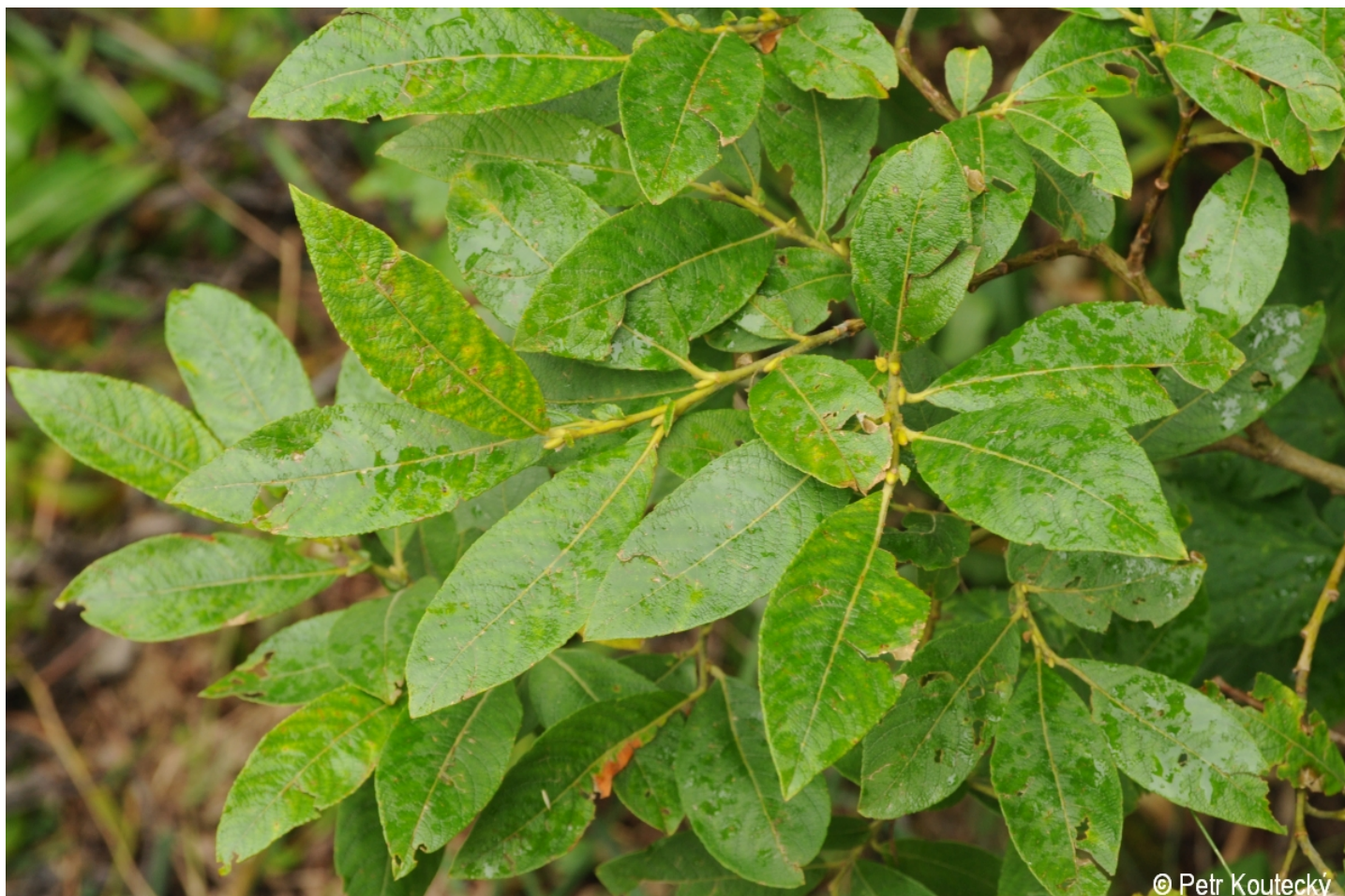
Salix appendiculata – Petr Koutecký – Velký Javor.