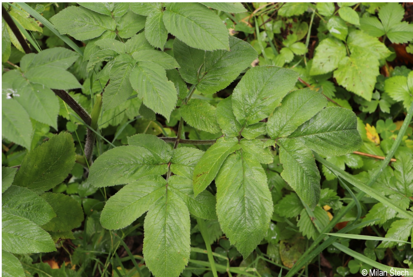
Chaerophyllum aromaticum – Milan Štech – Bližná.