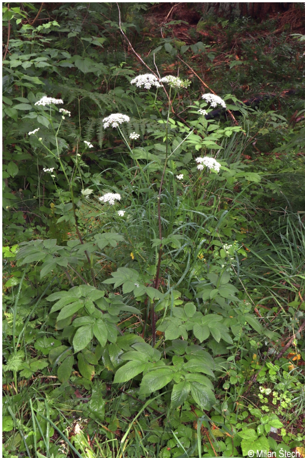
Chaerophyllum aromaticum – Milan Štech – Bližná.