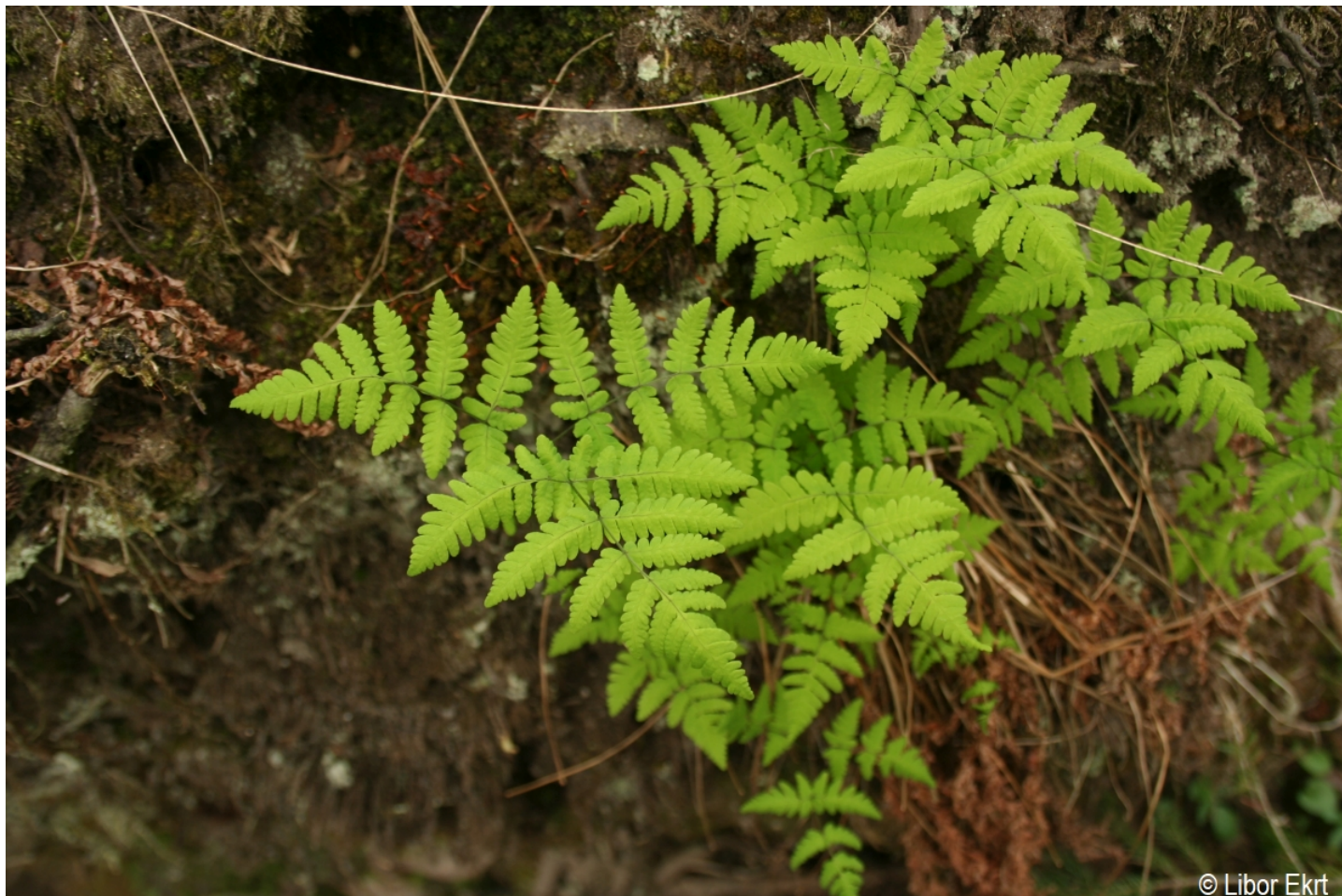
Gymnocarpium dryopteris – Libor Ekr – Strážný.