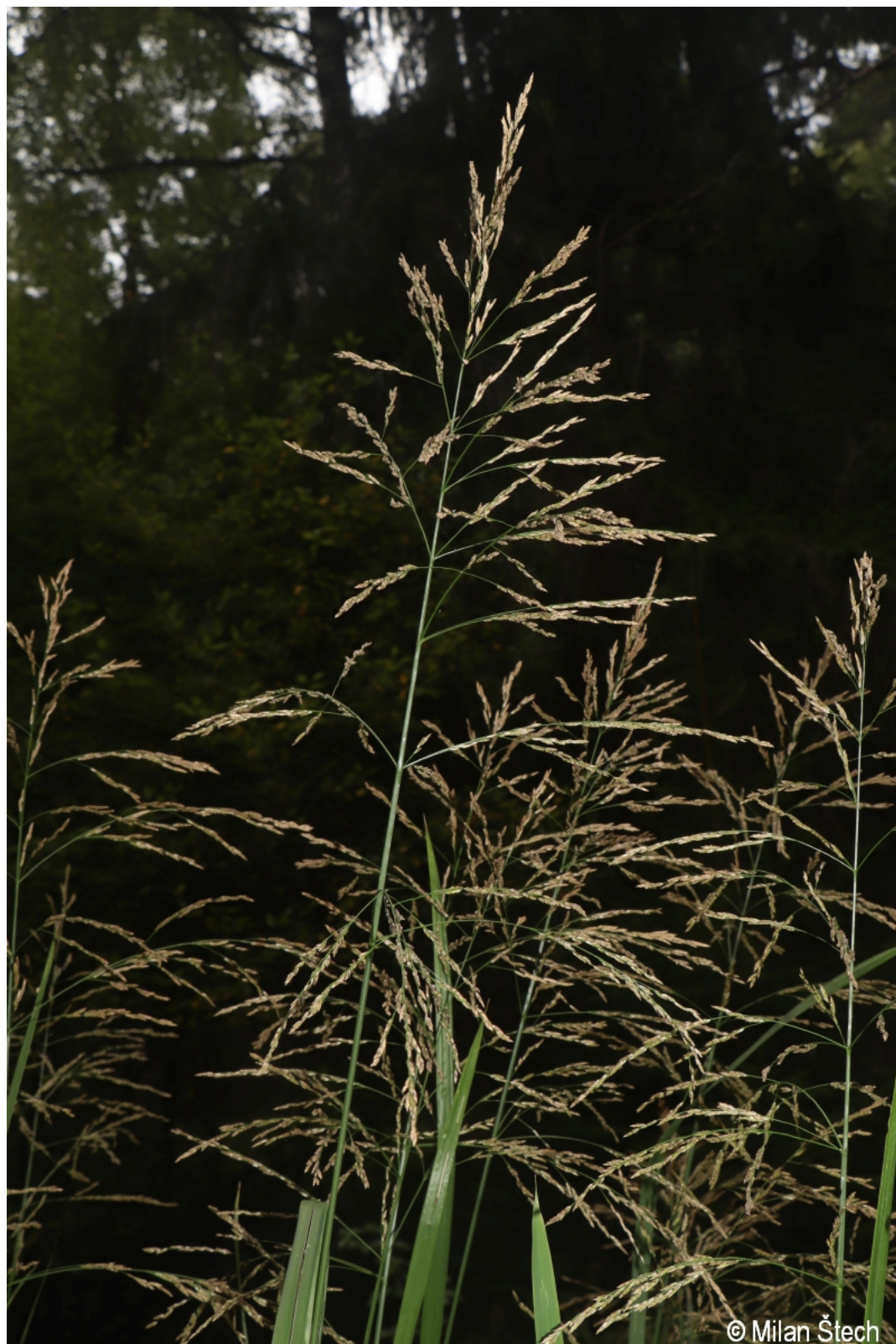
Glyceria maxima – Milan Štech – Olšina.