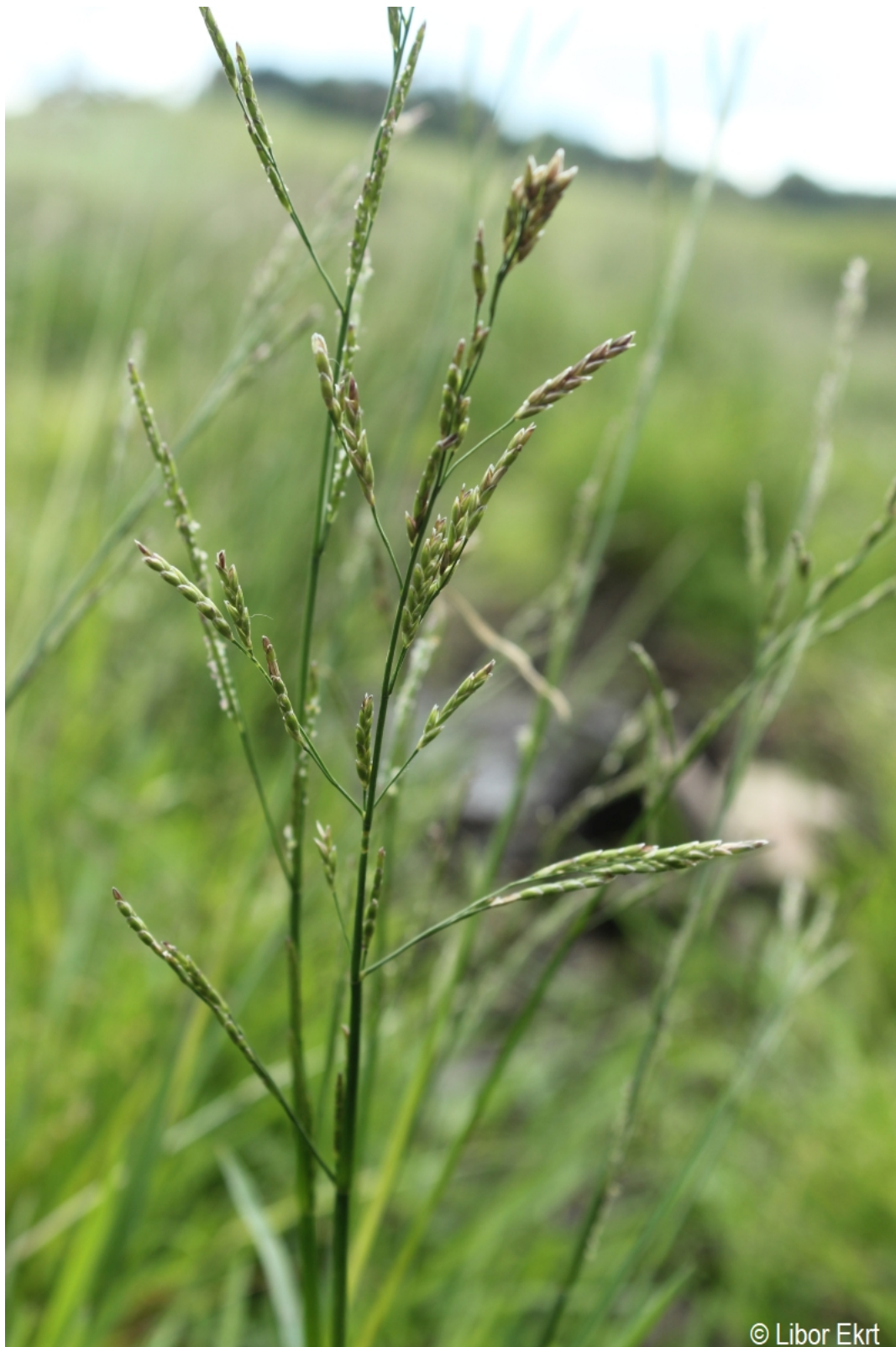
Glyceria declinata – Libor Ekrť – Černá v Pošumaví.