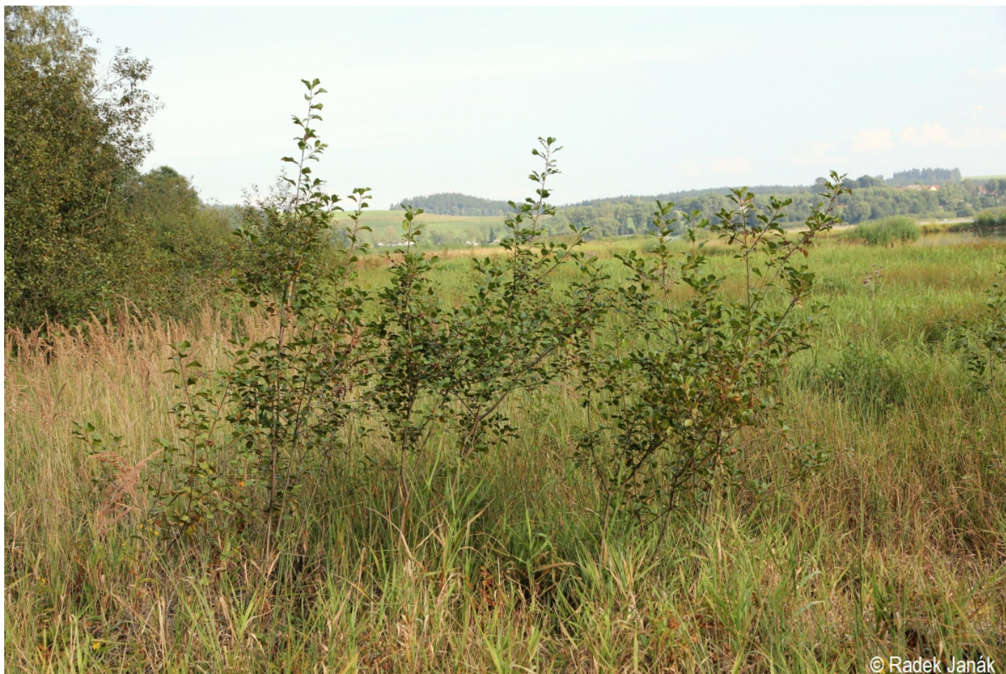
Frangula alnus – Radek Janák – Horní Planá, Olšov.