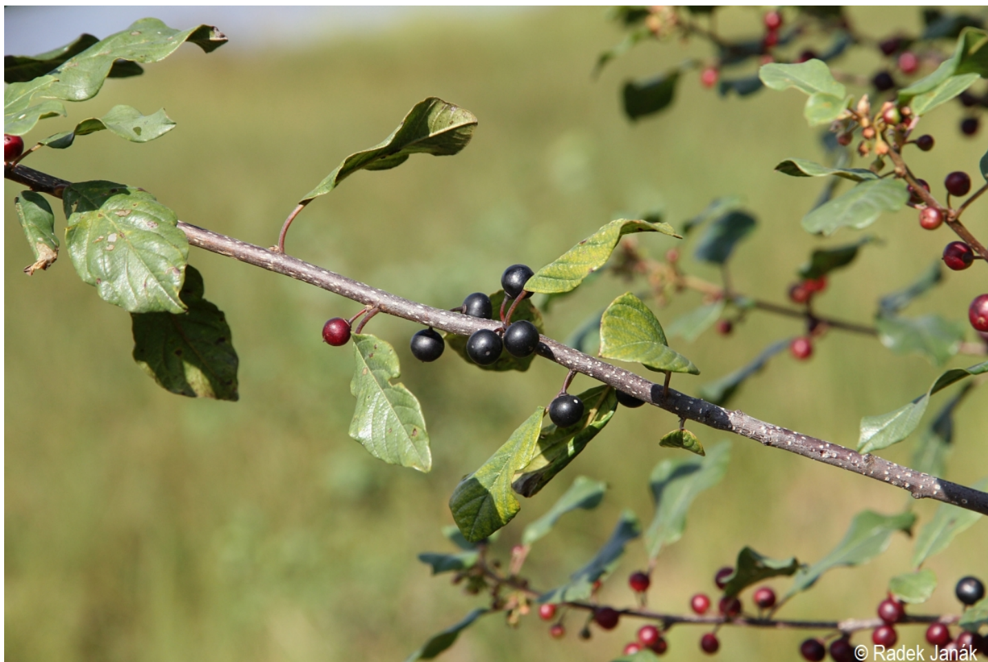
Frangula alnus – Radek Janák – Horní Planá, Olšov.