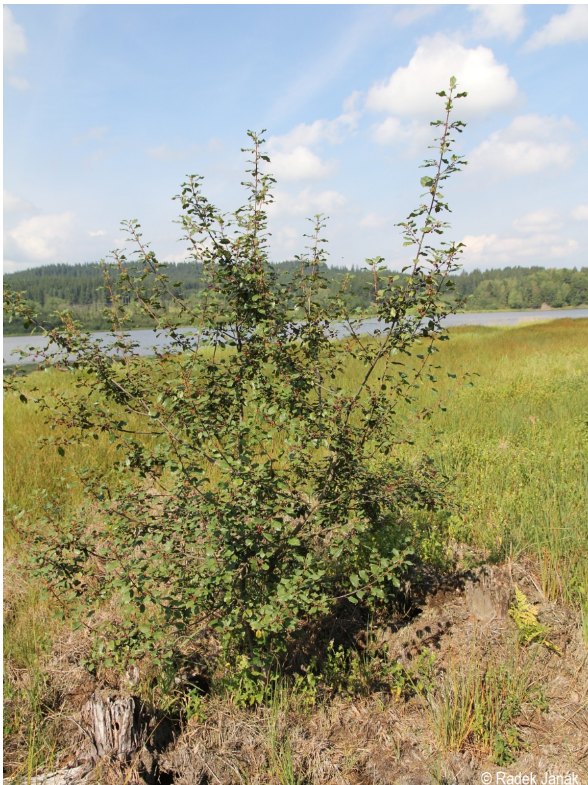
Frangula alnus – Radek Janák – Horní Planá, Olšov.