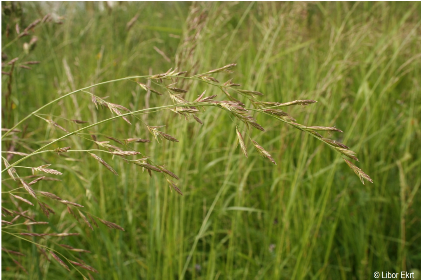
Festuca pratensis – Libor Ekrt – Zátoň.