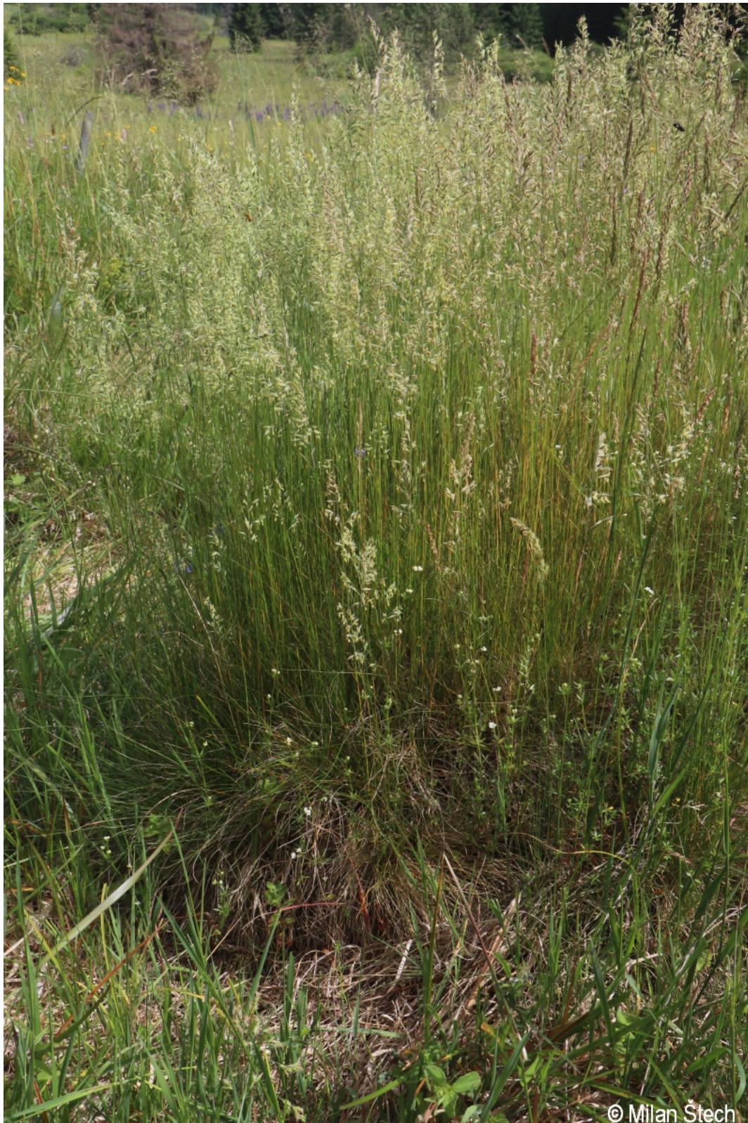
Festuca ovina – Milan Štech – Sonnenwald.