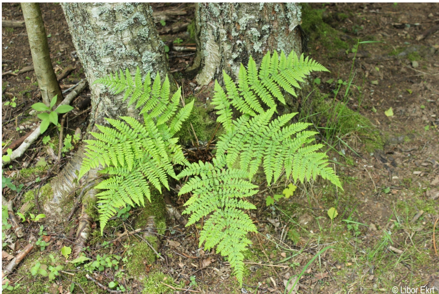
Dryopteris dilatata – Libor Ekrť – Pestrý vrch.