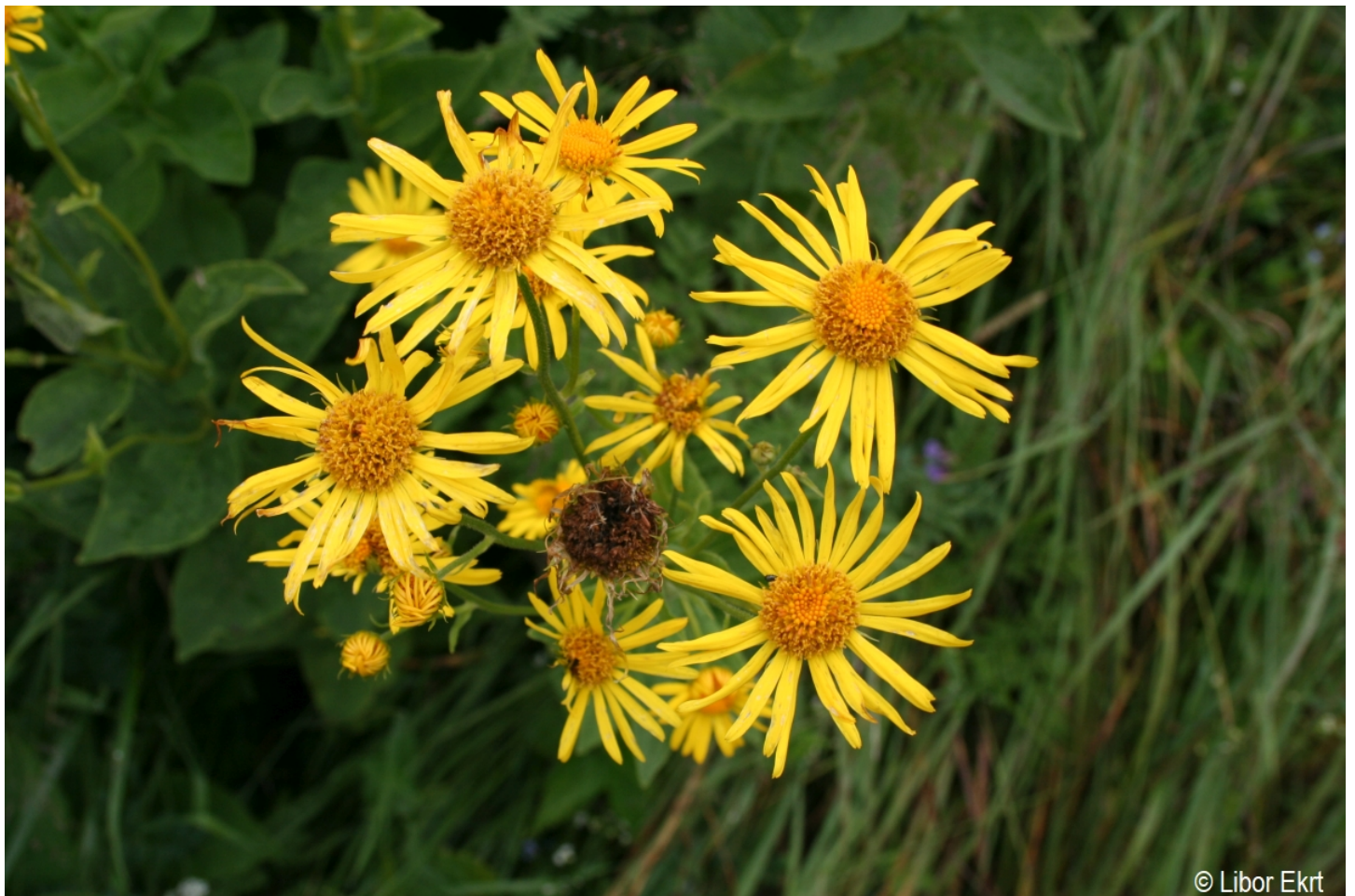
Doronicum austriacum – Libor Ekrt – Horská Kvilda.