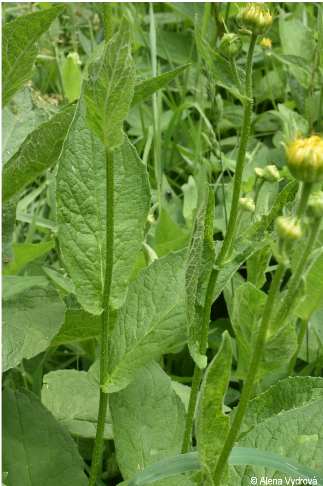
Doronicum austriacum – Alena Vydrová – Knížecí Pláně.