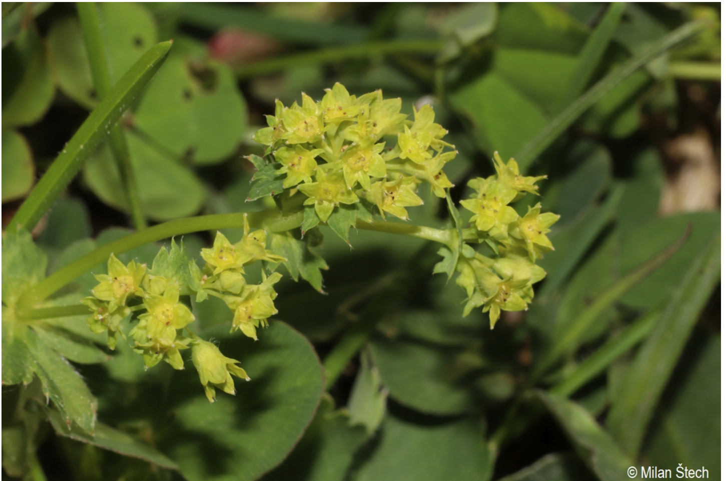
Alchemilla filicaulis subsp. filicaulis – Milan Štech – Mokrá.