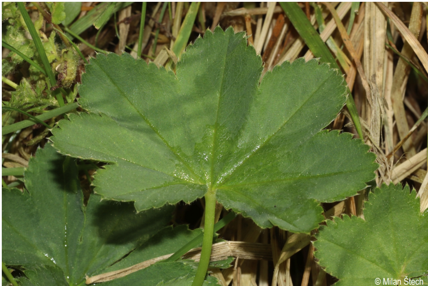
Alchemilla filicaulis subsp. filicaulis – Milan Štech – Mokrá.