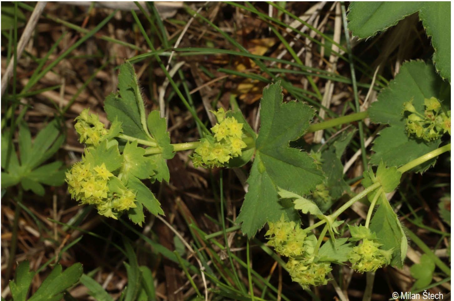
Alchemilla filicaulis subsp. filicaulis – Milan Štech – Mokrá.