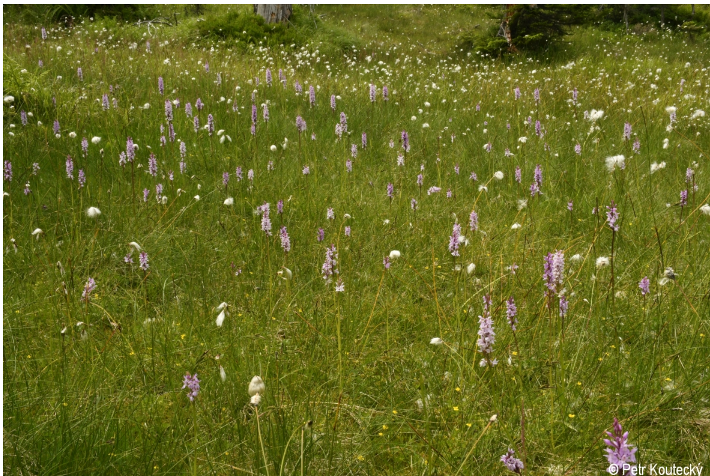
Dactylorhiza fuchsii – Petr Koutecký – Moorberg.