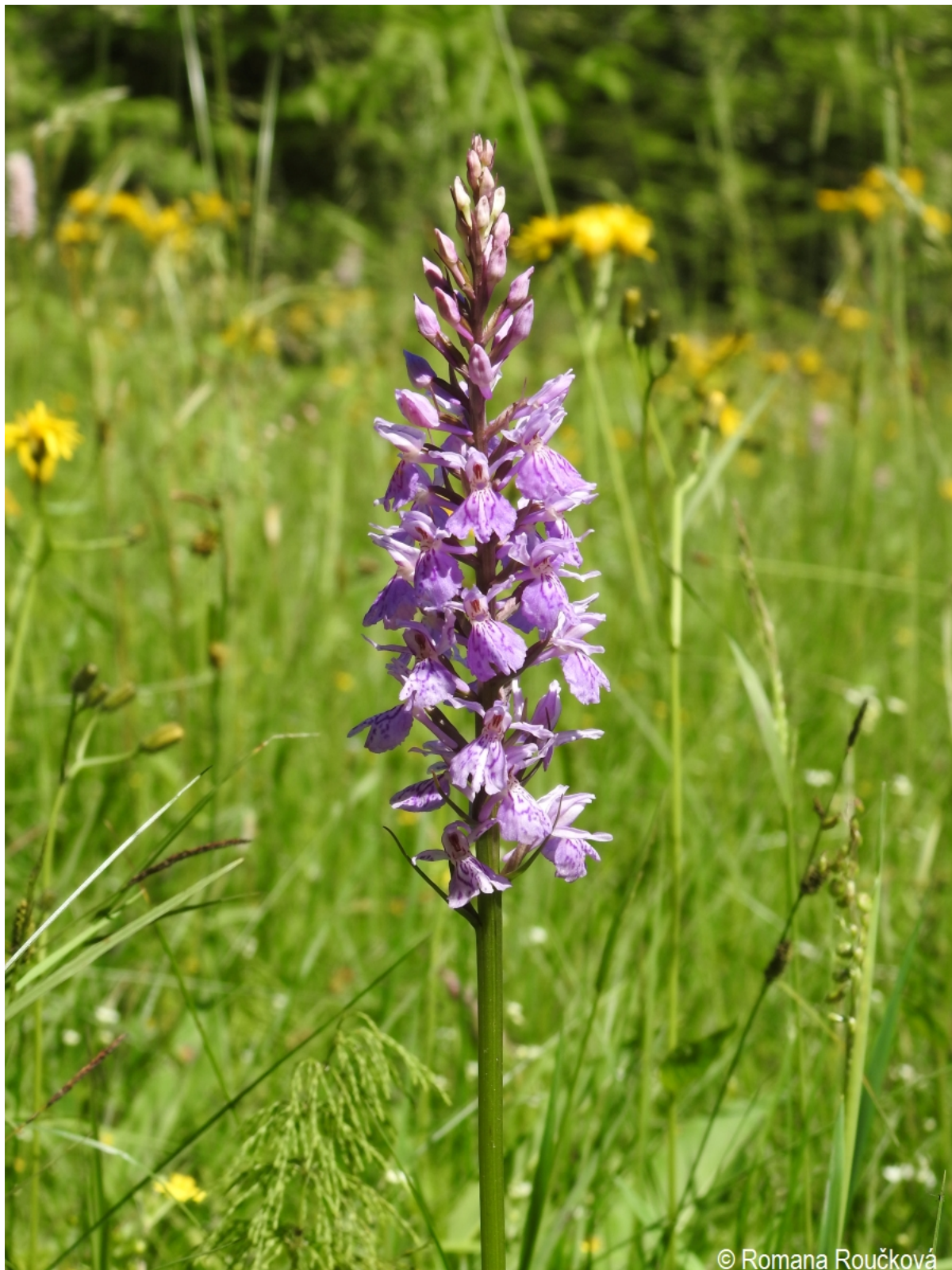
Dactylorhiza fuchsii – Romana Roučková – Srní, Sekerský potok.