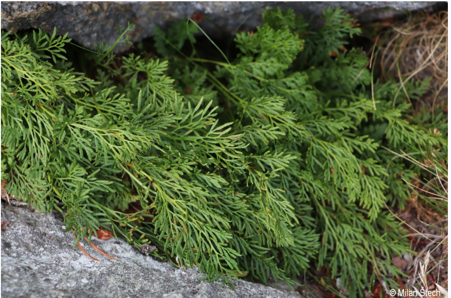
Cryptogramma crisa – Milan Štech – Velký Javor.