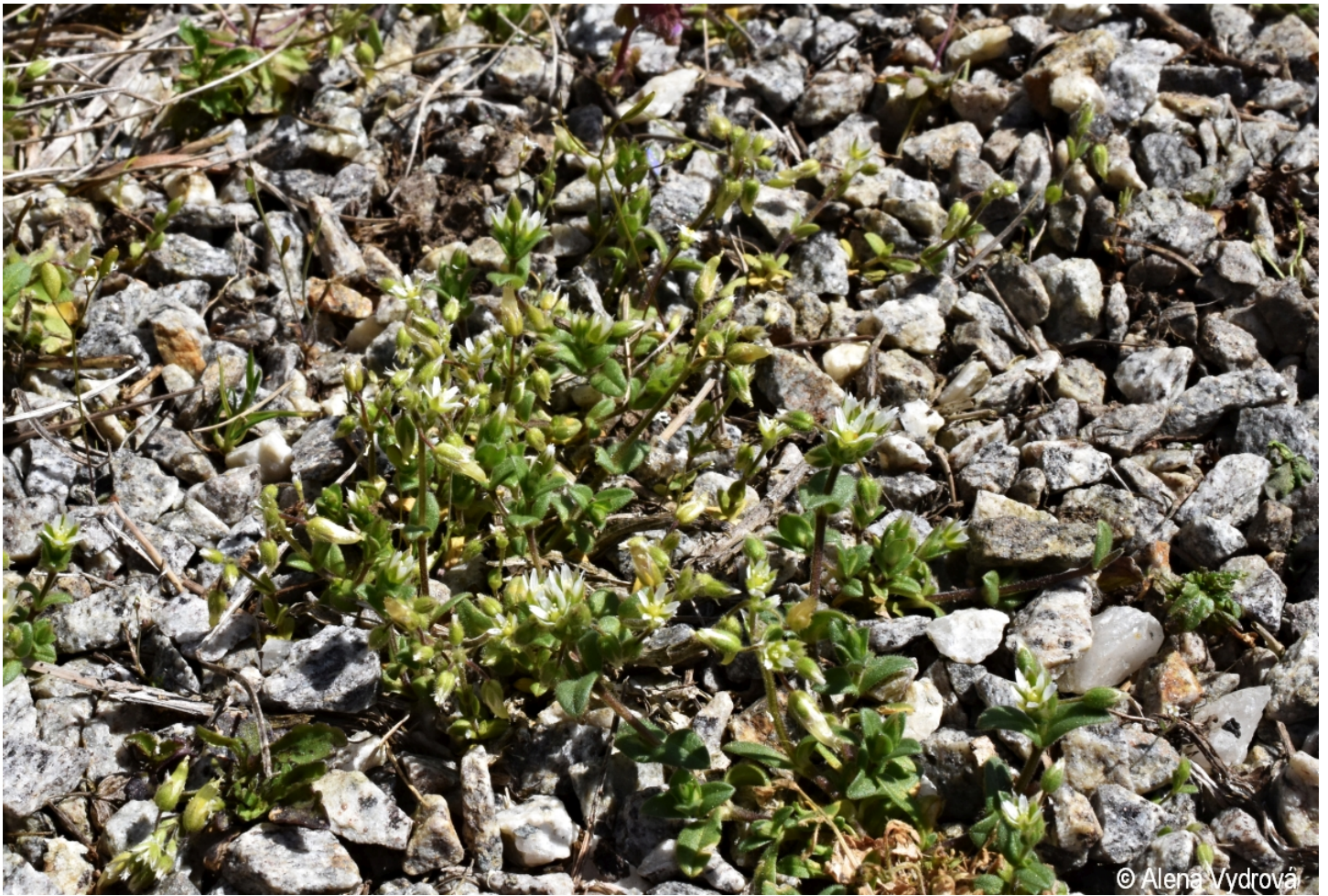
Cerastium semidecandrum – Alena Vydrová – Zbytiny - nádraží.