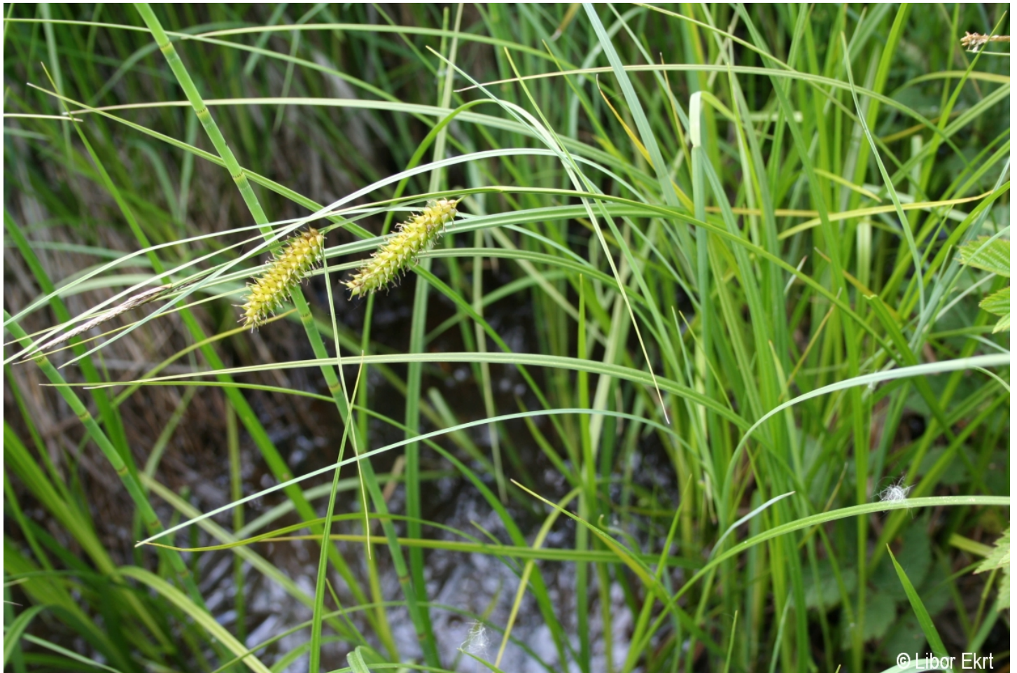
Carex vesicaria – Libor Ekrt – Olšina (rybník).