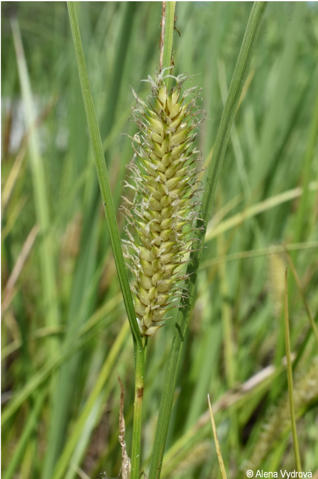
Carex vesicaria – Alena Vydrová – Olšina.