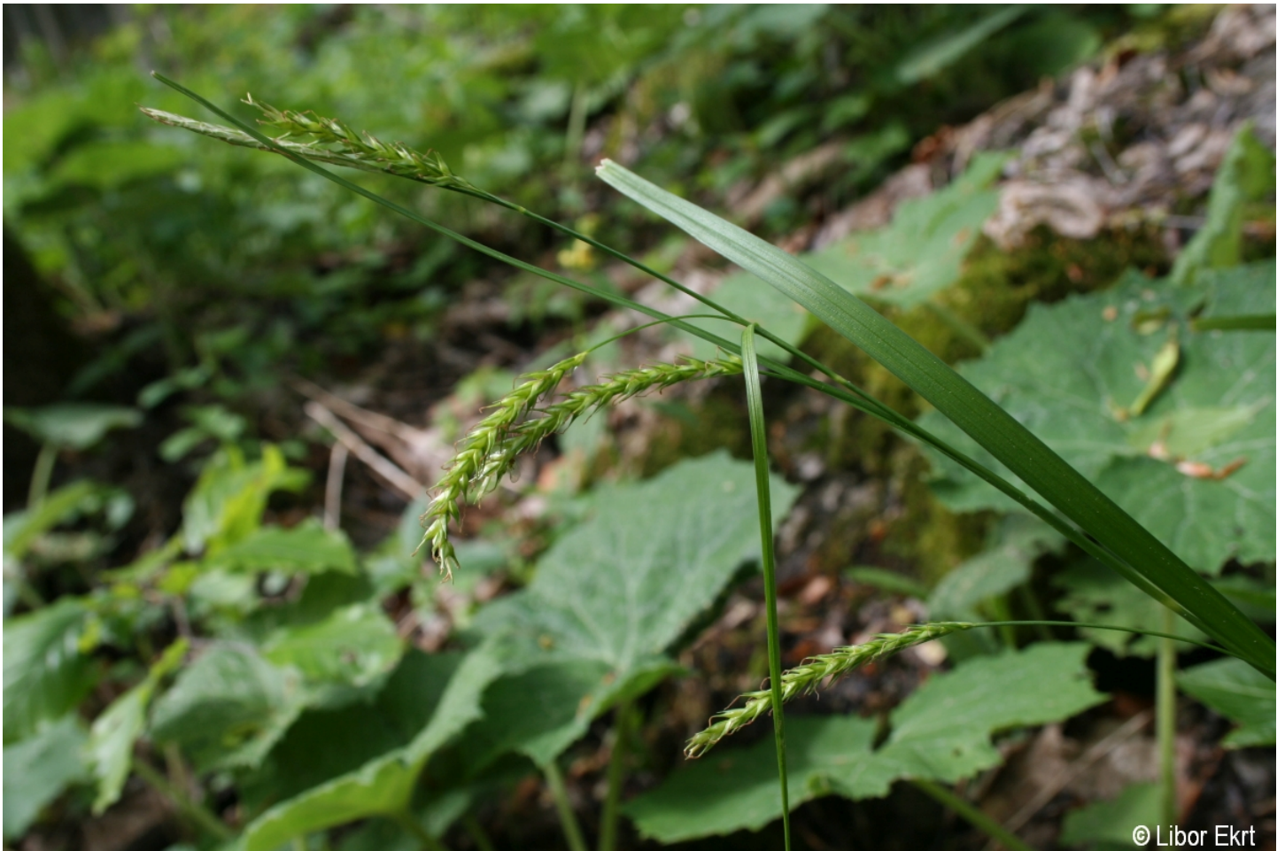
Carex sylvatica – Libor Ekrt – Spáleníště.