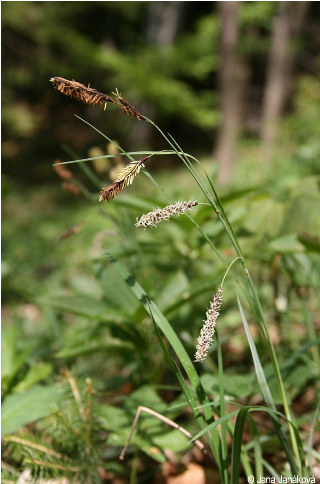
Carex flacca – Jana Janáková – Loučovice.