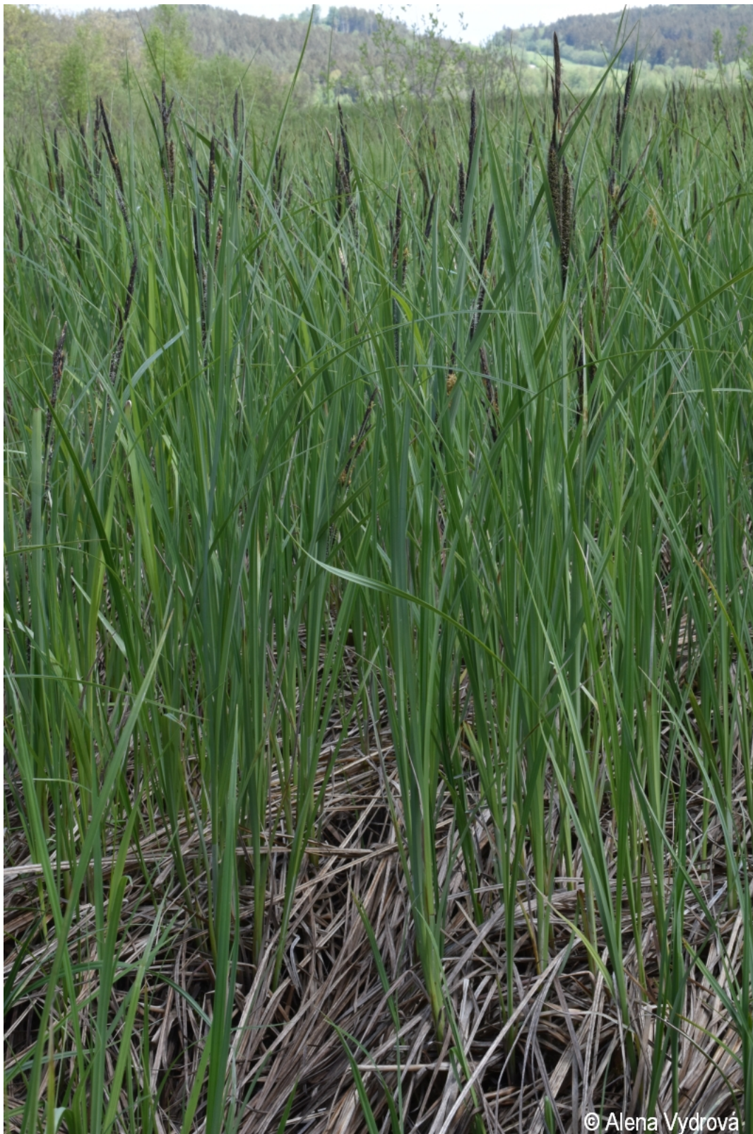
Carex acuta – Alena Vydrová – Olšina.