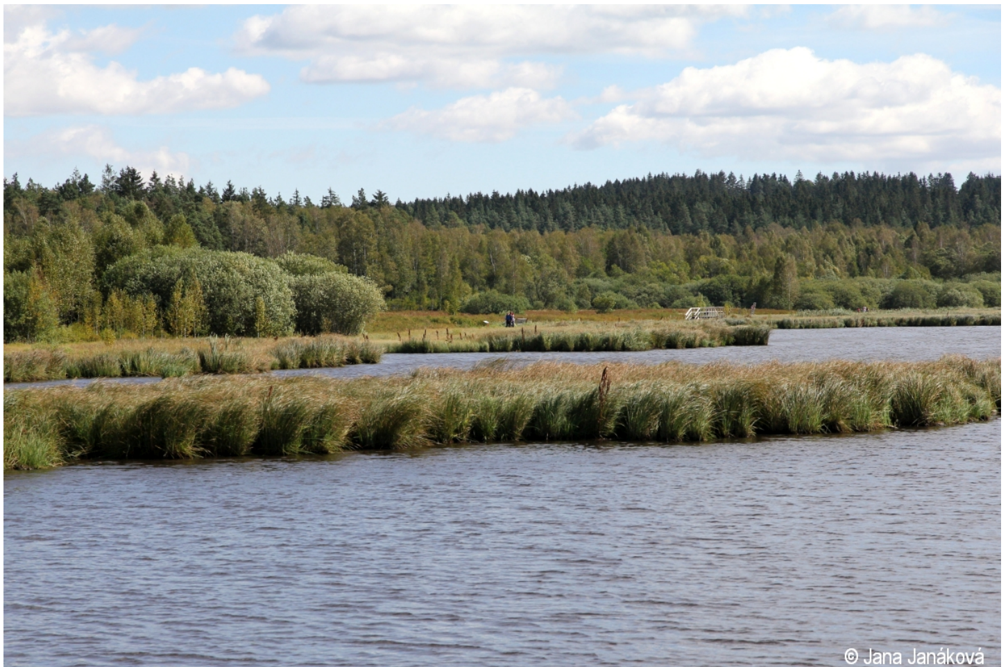
Carex acuta – Jana Janáková – Olšina.