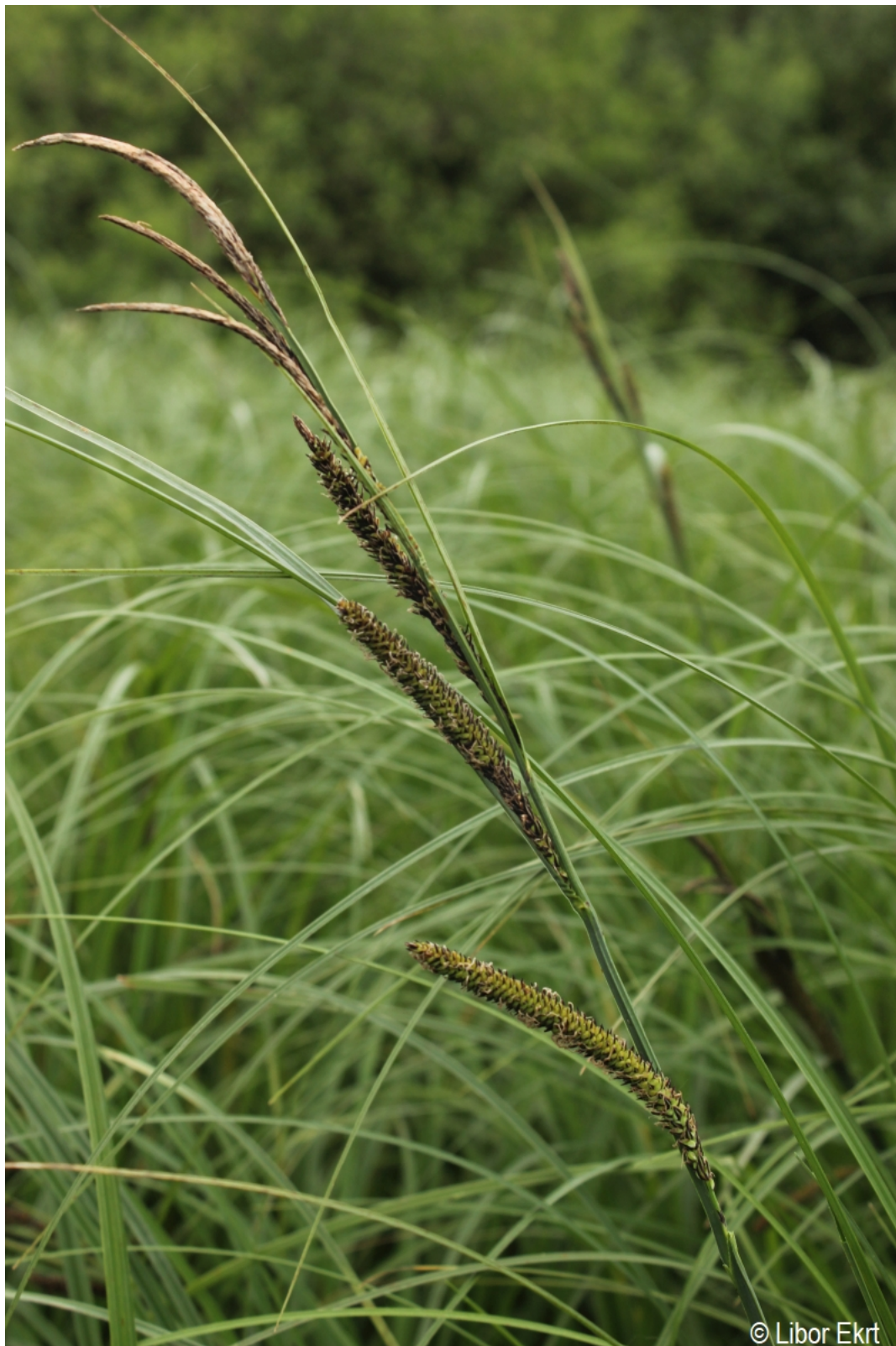
Carex acuta – Libor Ekrť – Černá v Pošumaví.