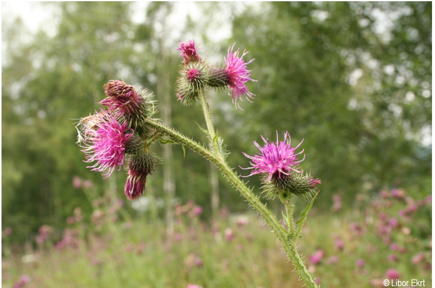
Carduus personata – Libor Ekrť – Strážný.