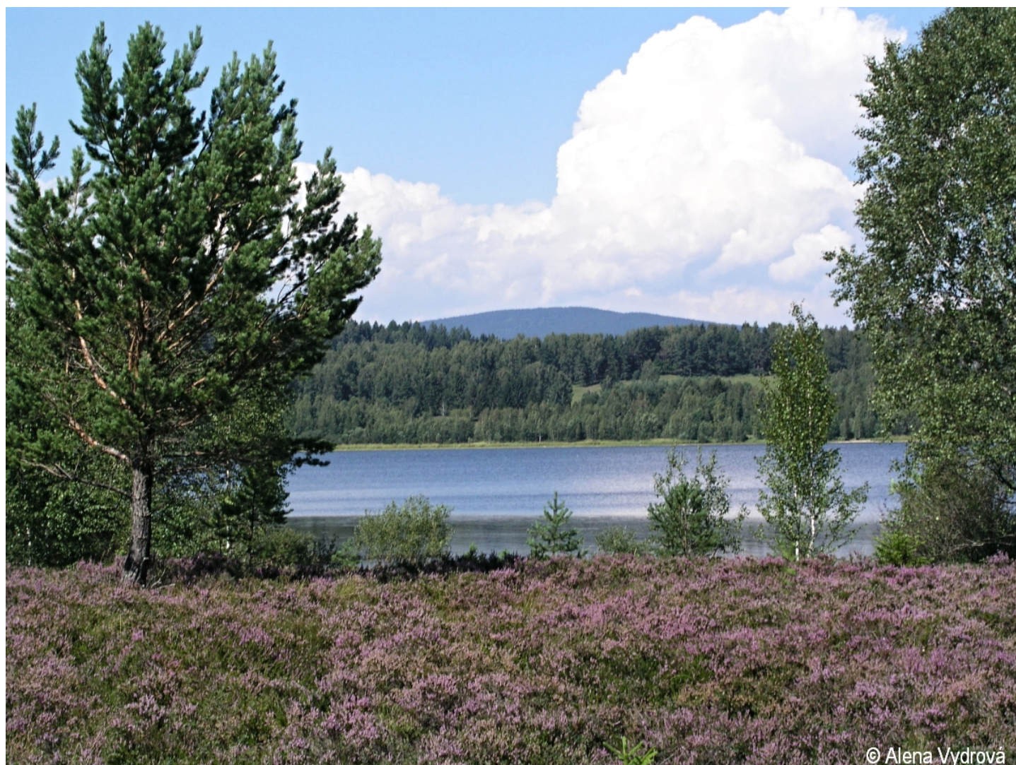
Calluna vulgaris – Alena Vydrová – Rašeliniště Borková.