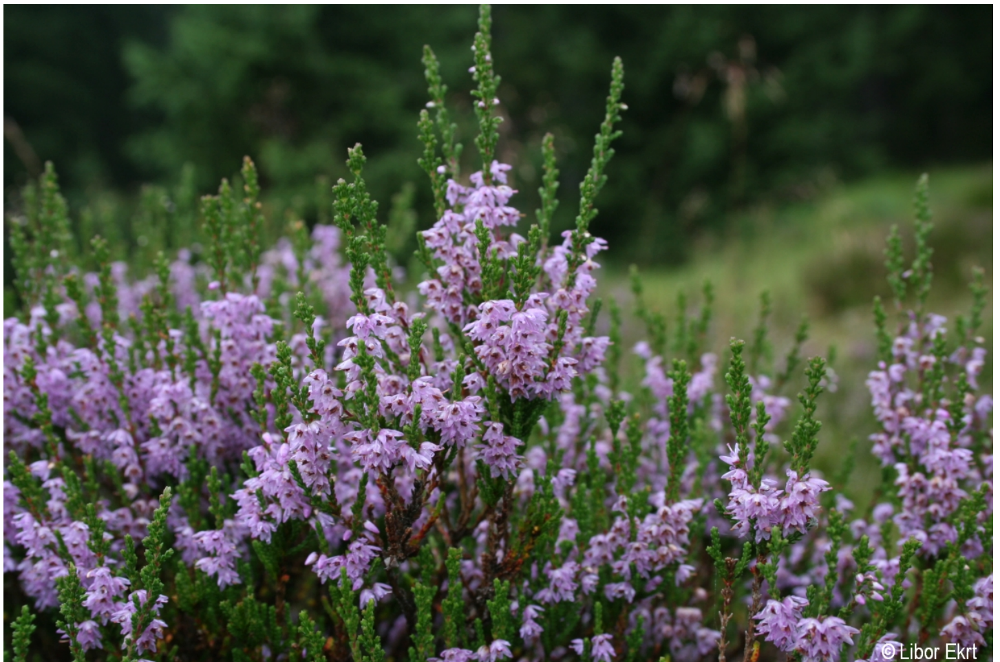
Calluna vulgaris – Libor Ekrt – Roklanský potok.