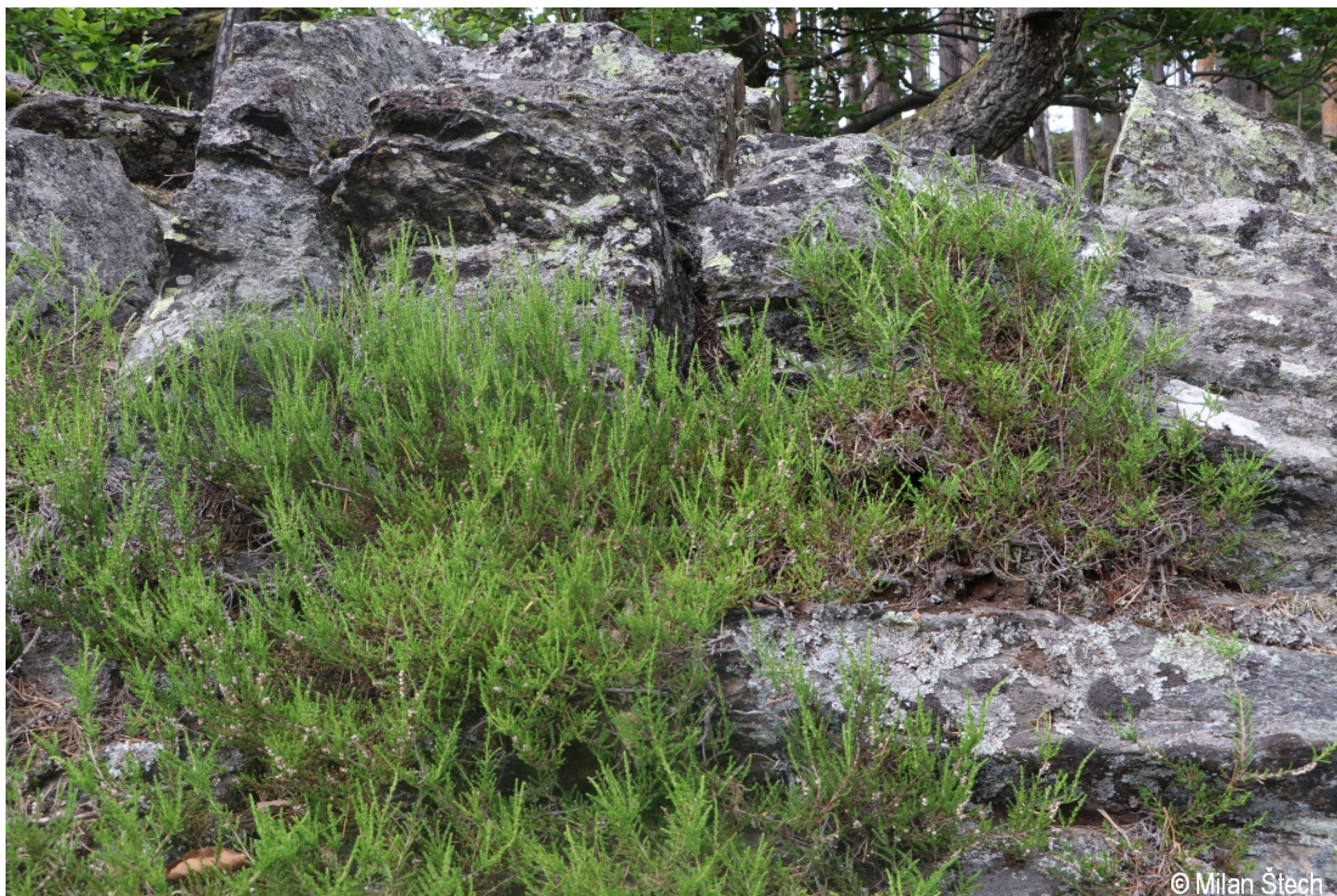
Calluna vulgaris – Milan Štech – Dračí skály.