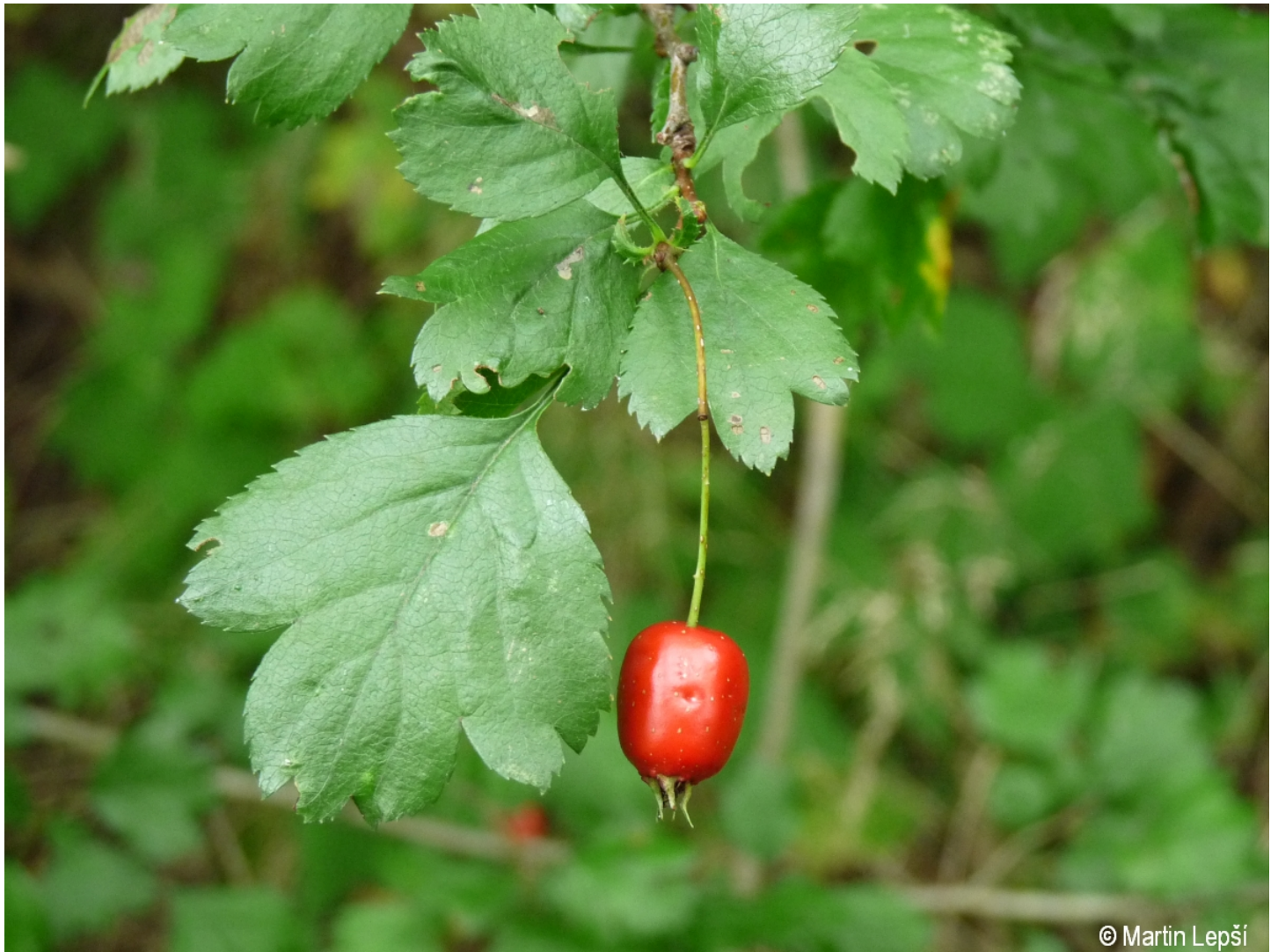
Crataegus xcalycina – Martin Lepší – Strašín.