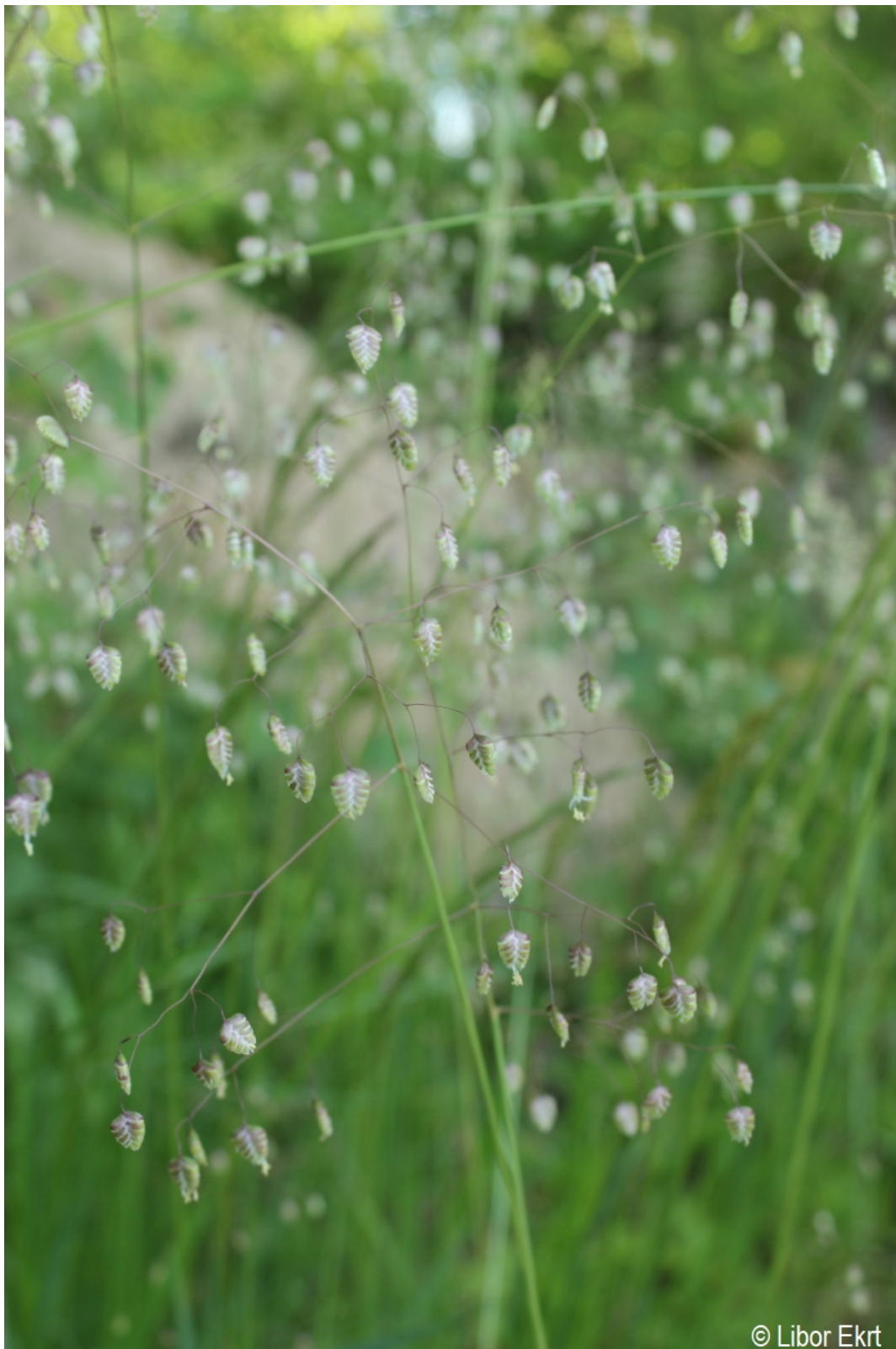
Briza media – Libor Ekrť – Zátoň.