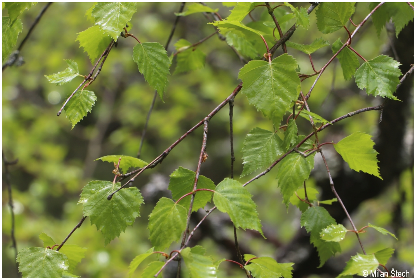
Betula pendula – Milan Štech – Losenice.