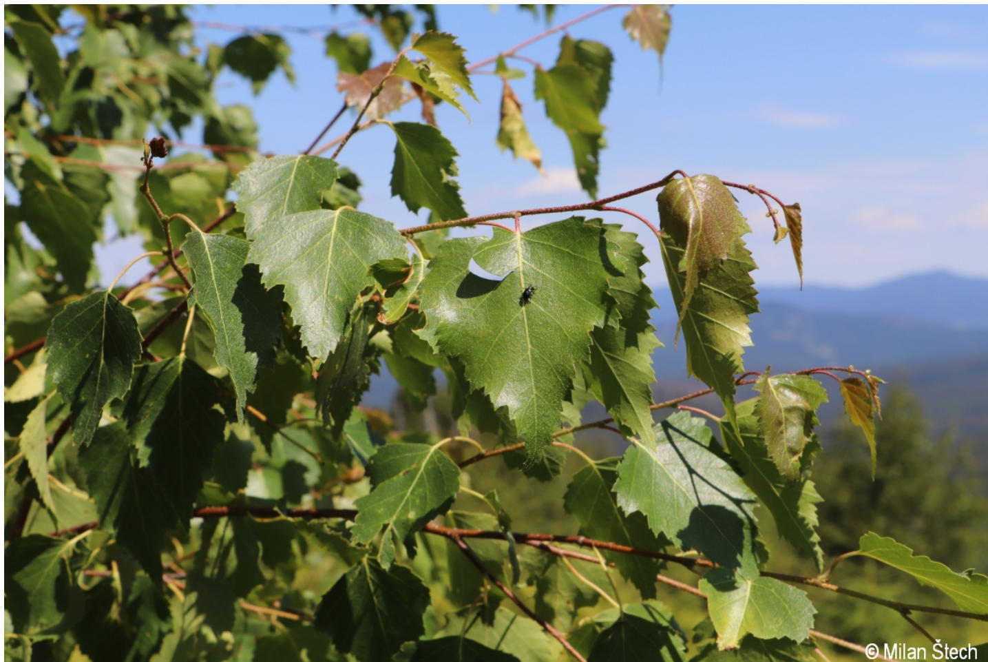
Betula pendula – Milan Štech – Třístoličník.