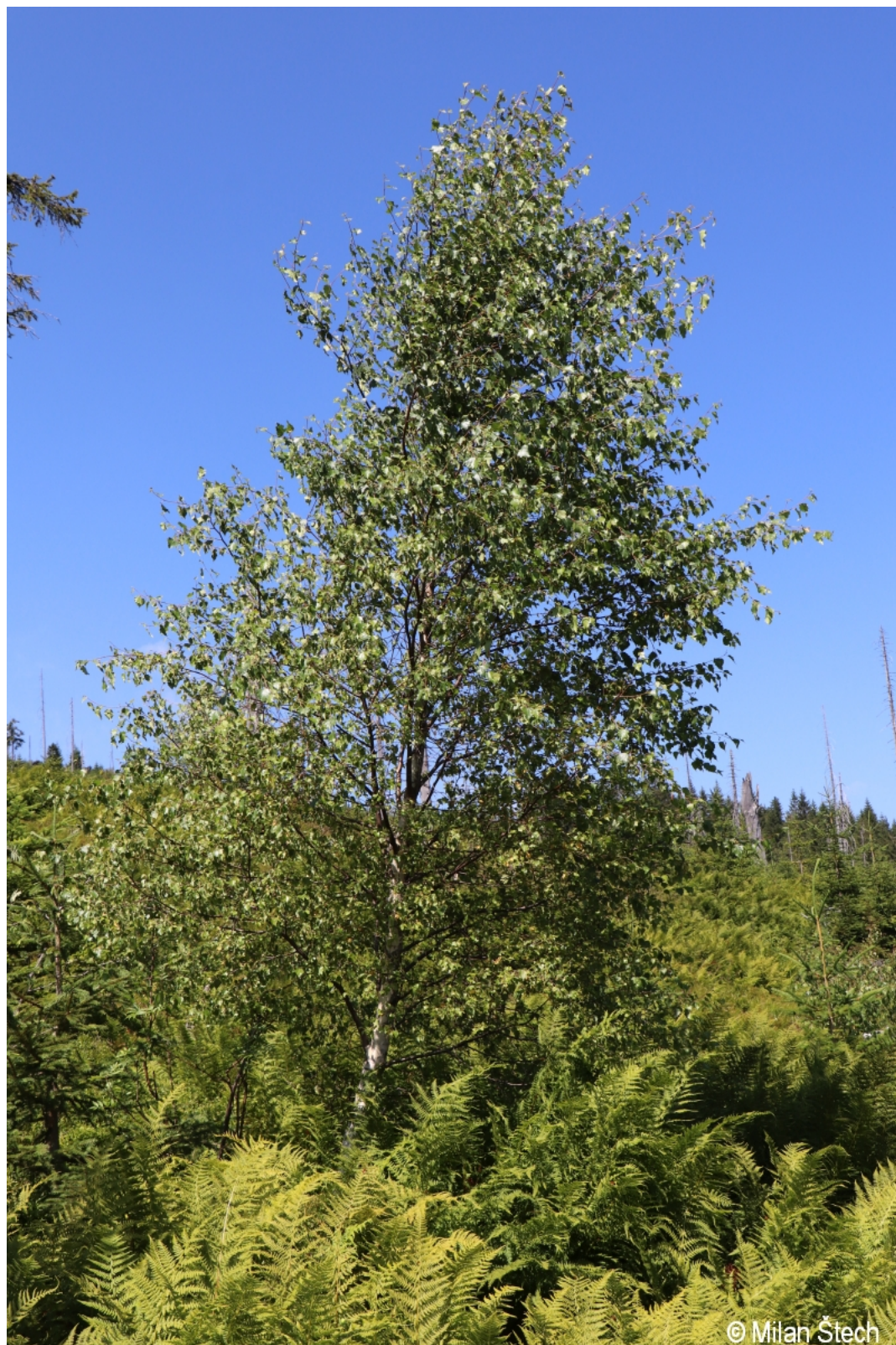
Betula pendula – Milan Štech – Třístoličník.