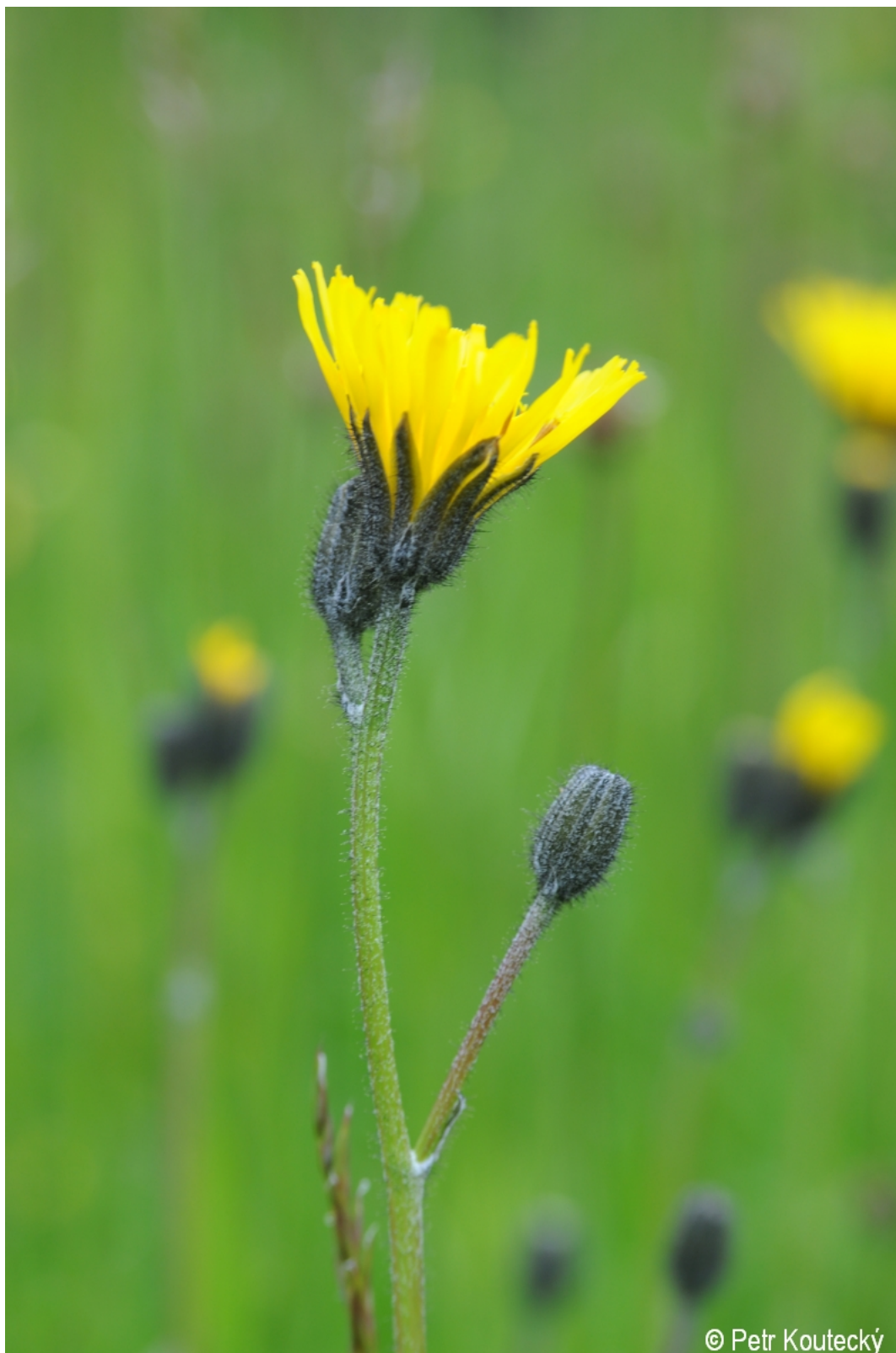
Willemetia stipitata – Petr Koutecký – Dolní Sněžná.