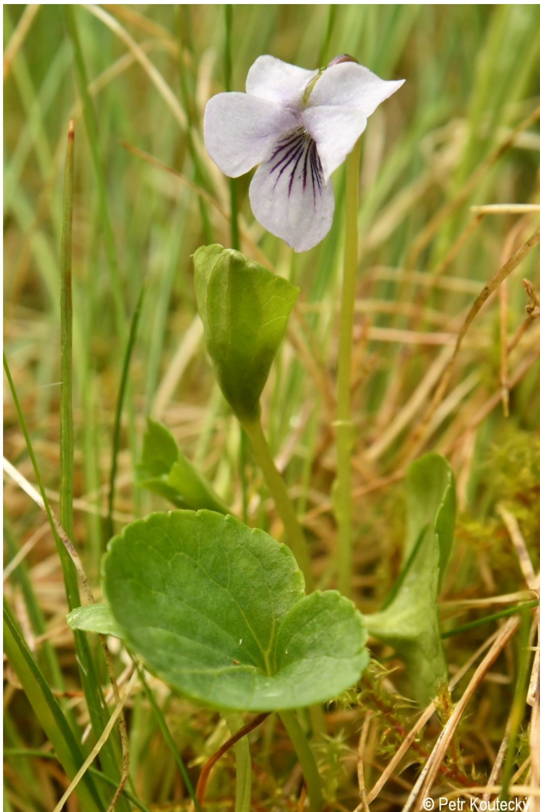
Viola palustris – Petr Kouček – Včelná pod Boubínem.