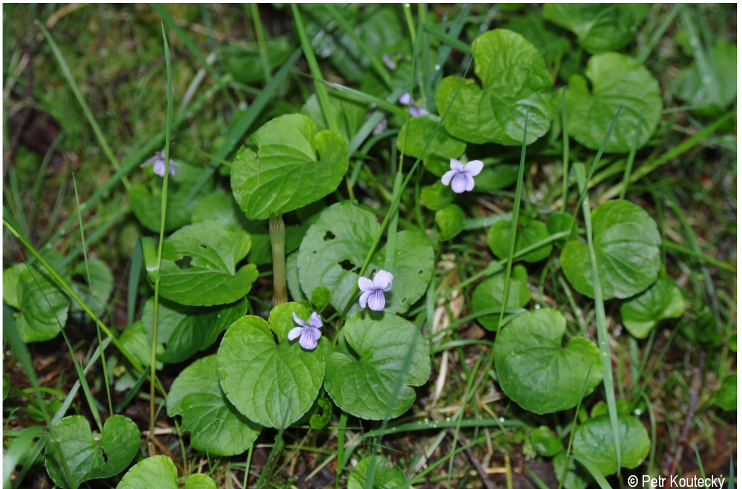
Viola palustris – Petr Koučeký – Horní Sněžná.