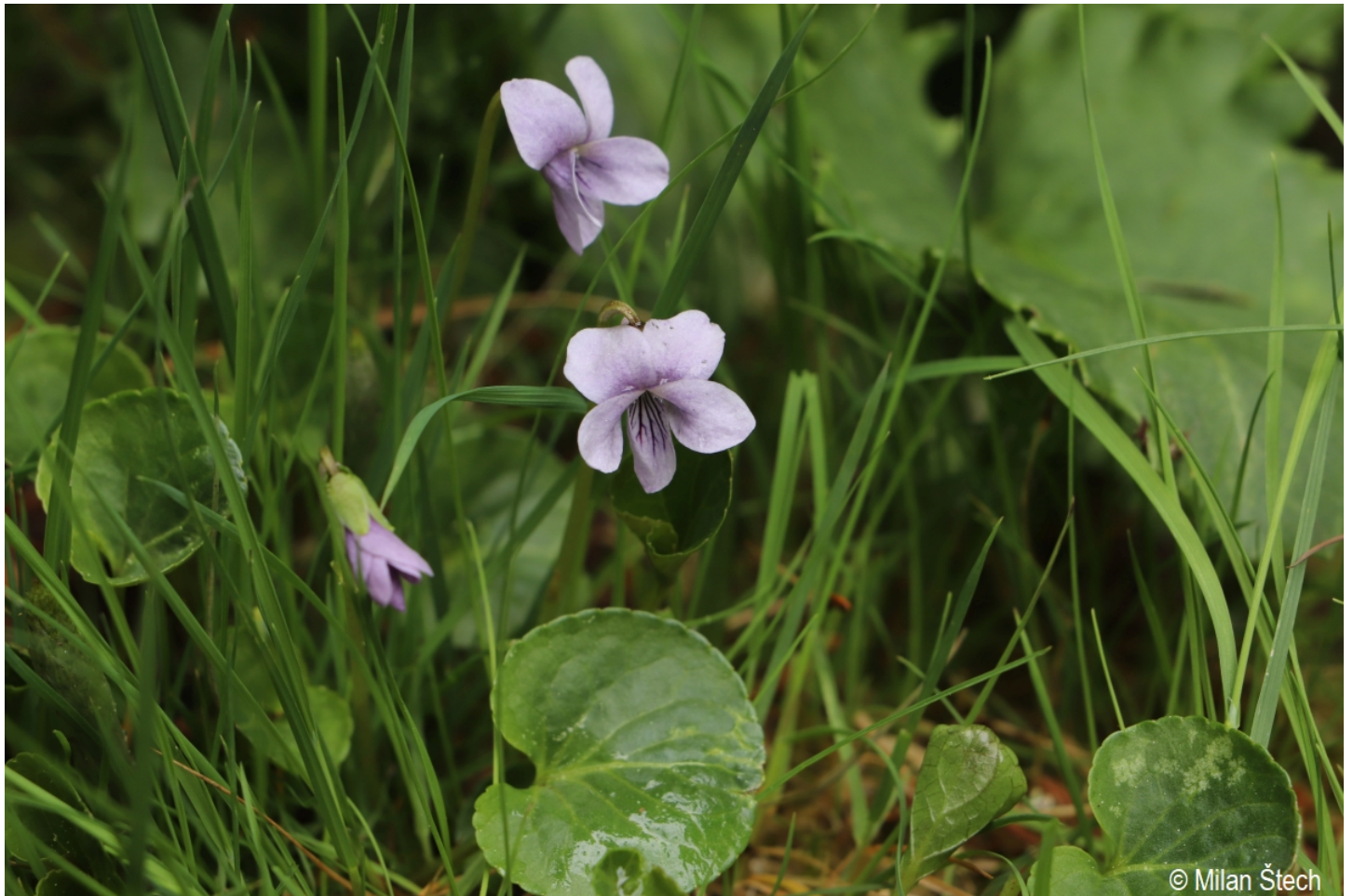
Viola palustris – Milan Štech – Kotlina Valné.