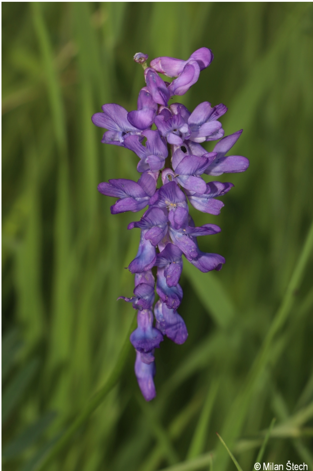
Vicia cracca – Milan Štech – Kvilda.