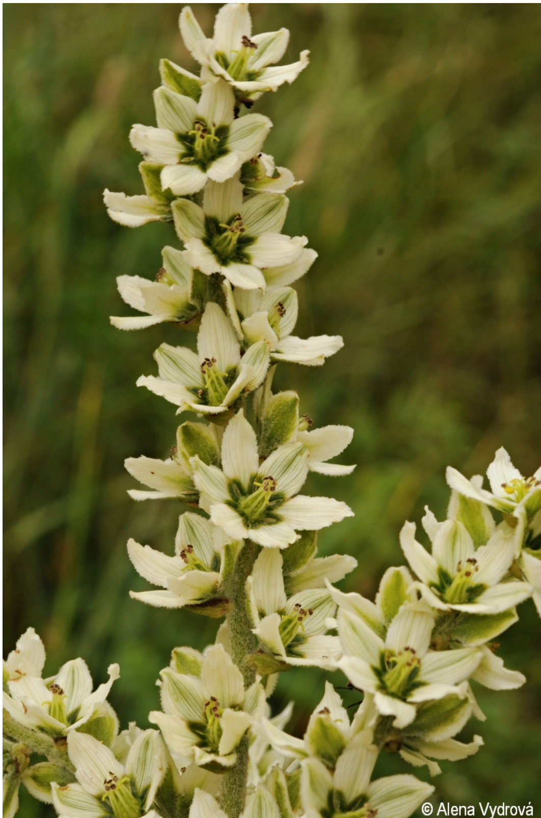
Veratrum album – Alena Vydrová – Boletice.