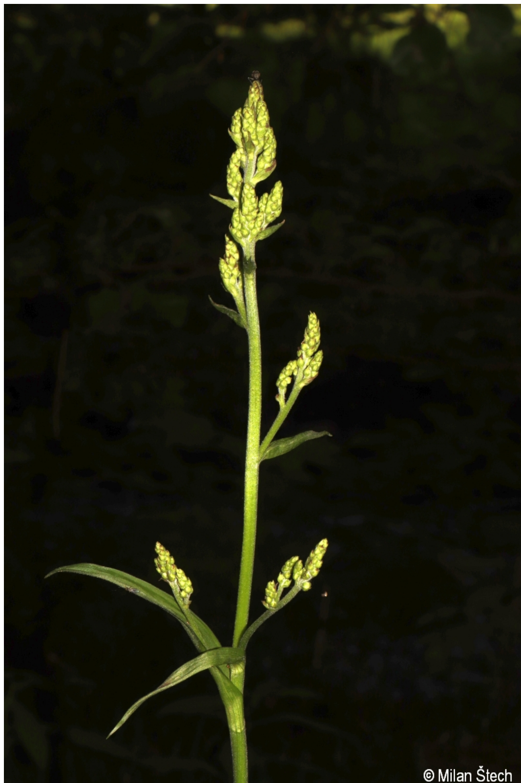
Veratrum album – Milan Štech – Kockendorf.