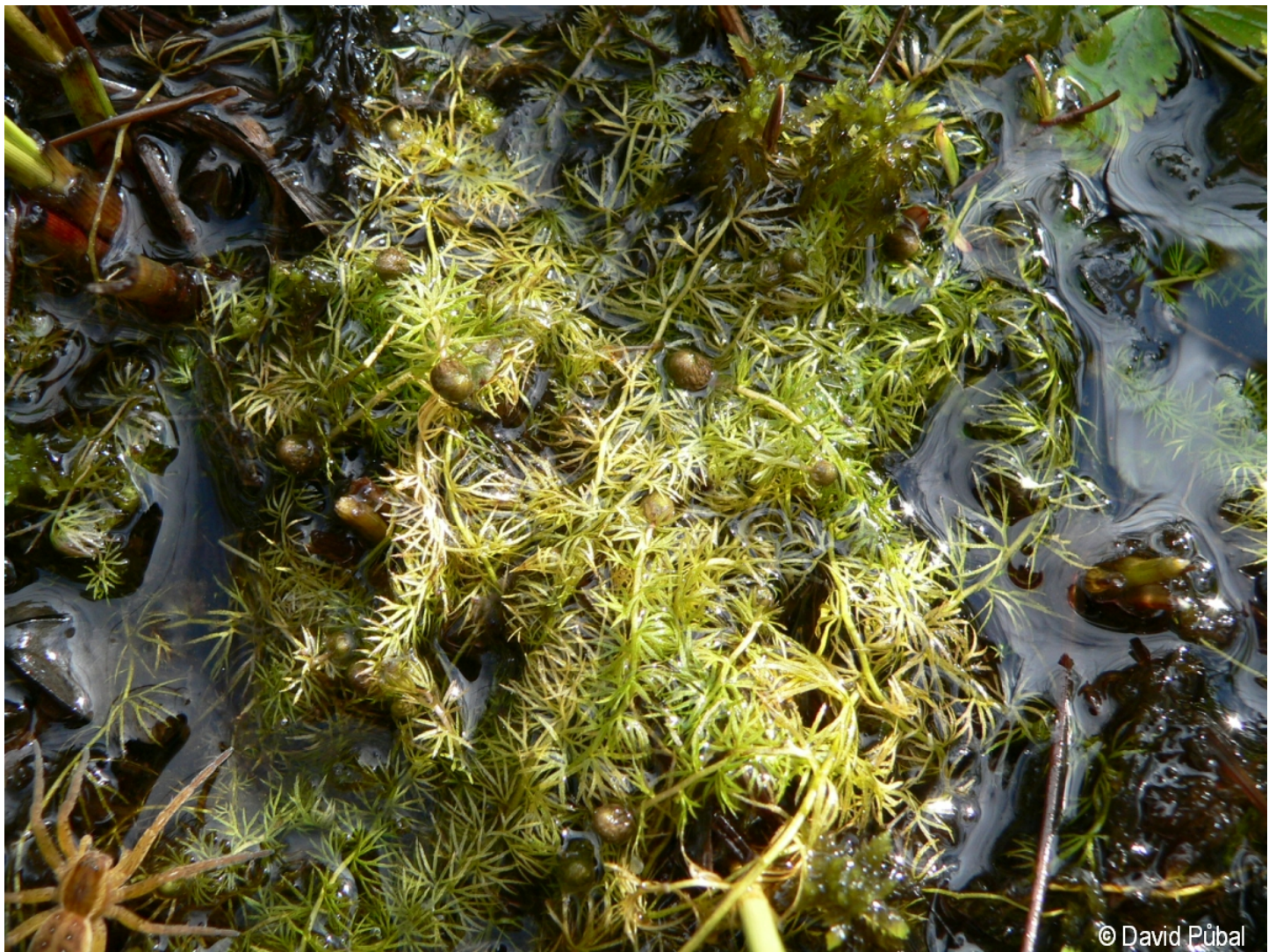
Ulmus minor – David Půbal – Kyselov.