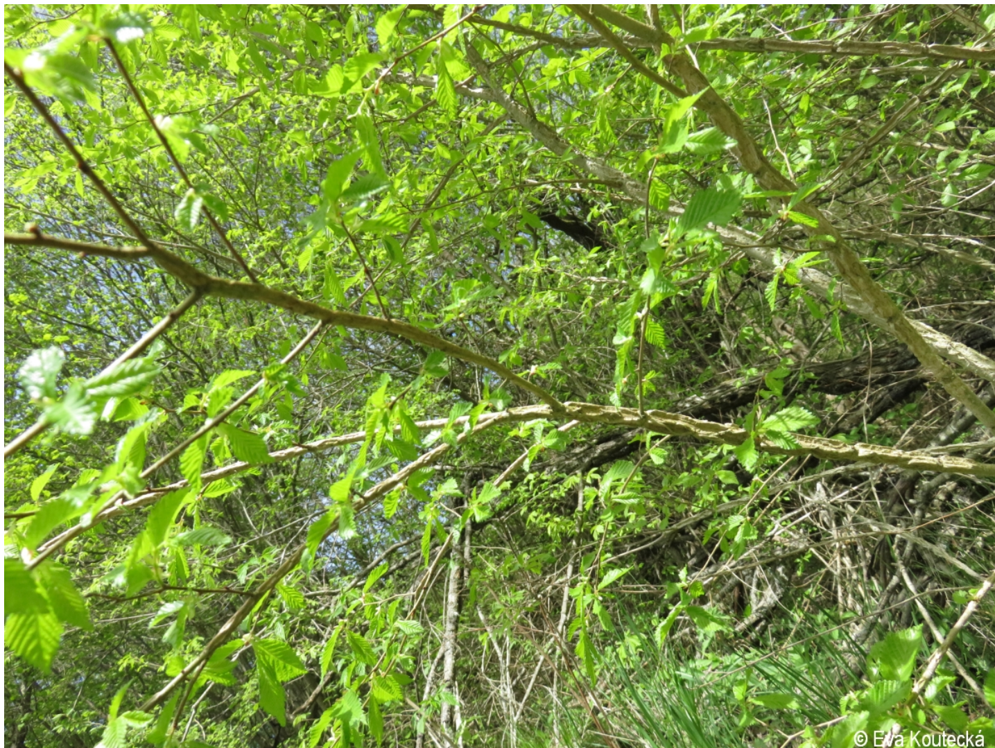
Ulmus minor – Eva Koutecká – Uhlíkov.