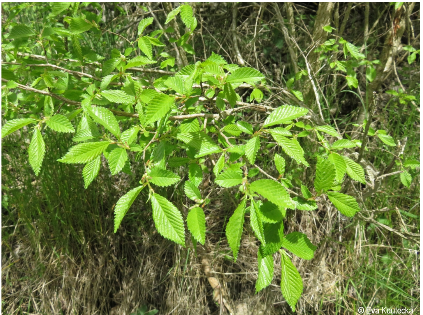
Ulmus minor – Eva Koutecká – Uhlíkov.