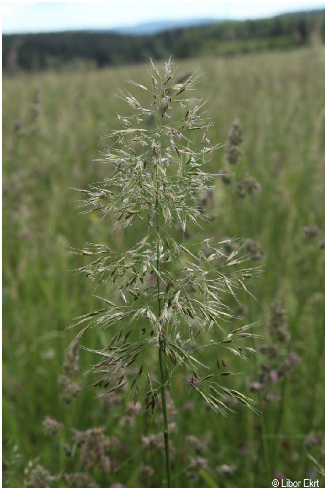
Trisetum flavescens – Libor Ekrť – Černá v Pošumaví.