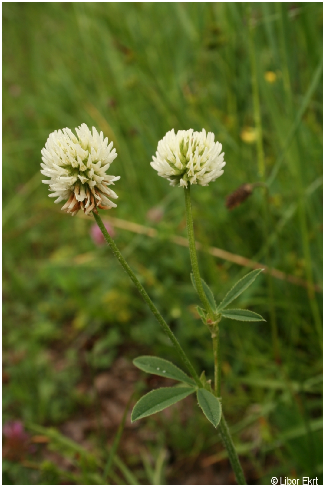
Trifolium montanum – Libor Ekrť – Lenora.