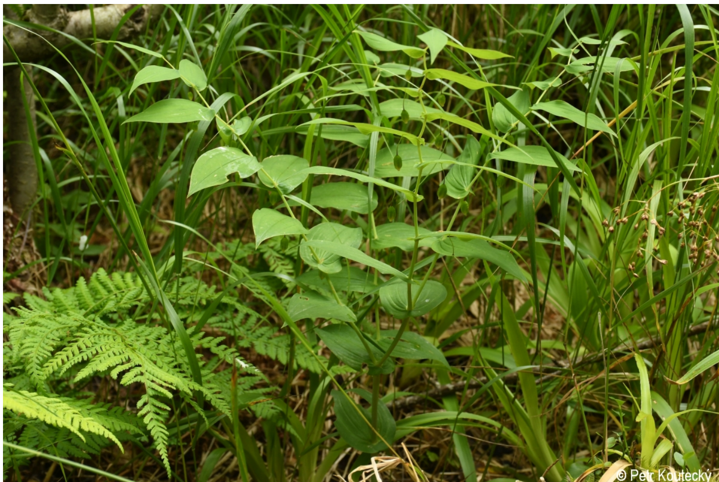
Streptopus amplexifolius – Petr Kouřecký – Lusen.