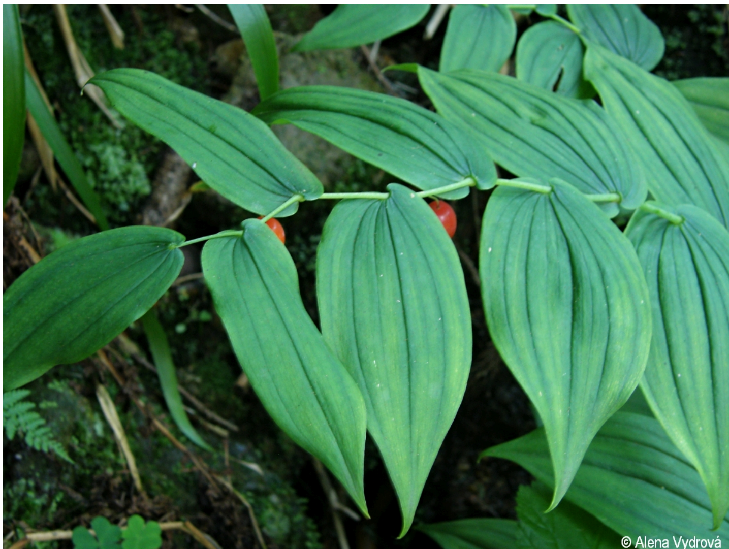
Streptopus amplexifolius – Alena Vydrová – Smrčina.