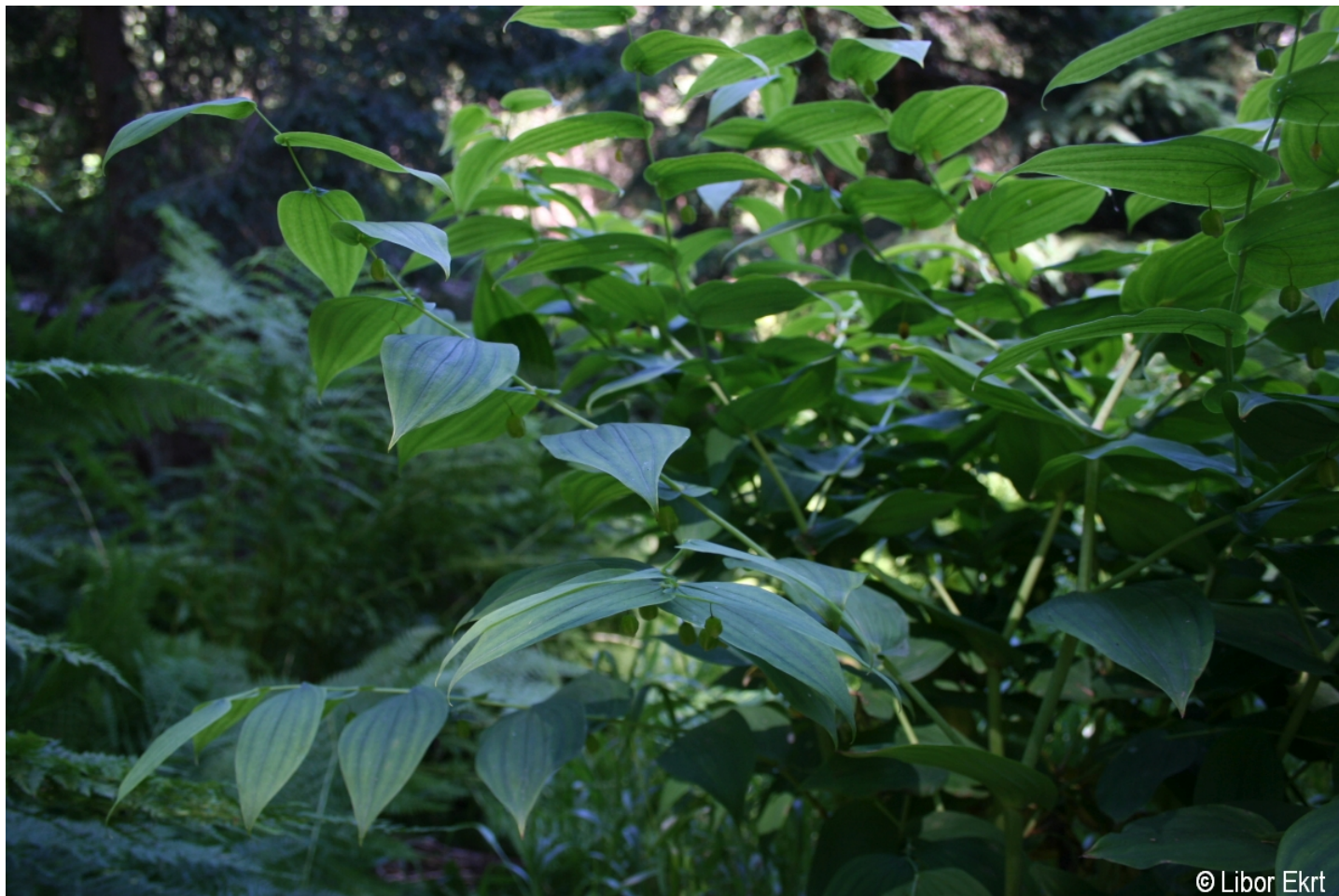
Streptopus amplexifolius – Libor Ekrť – Plešné jezero.