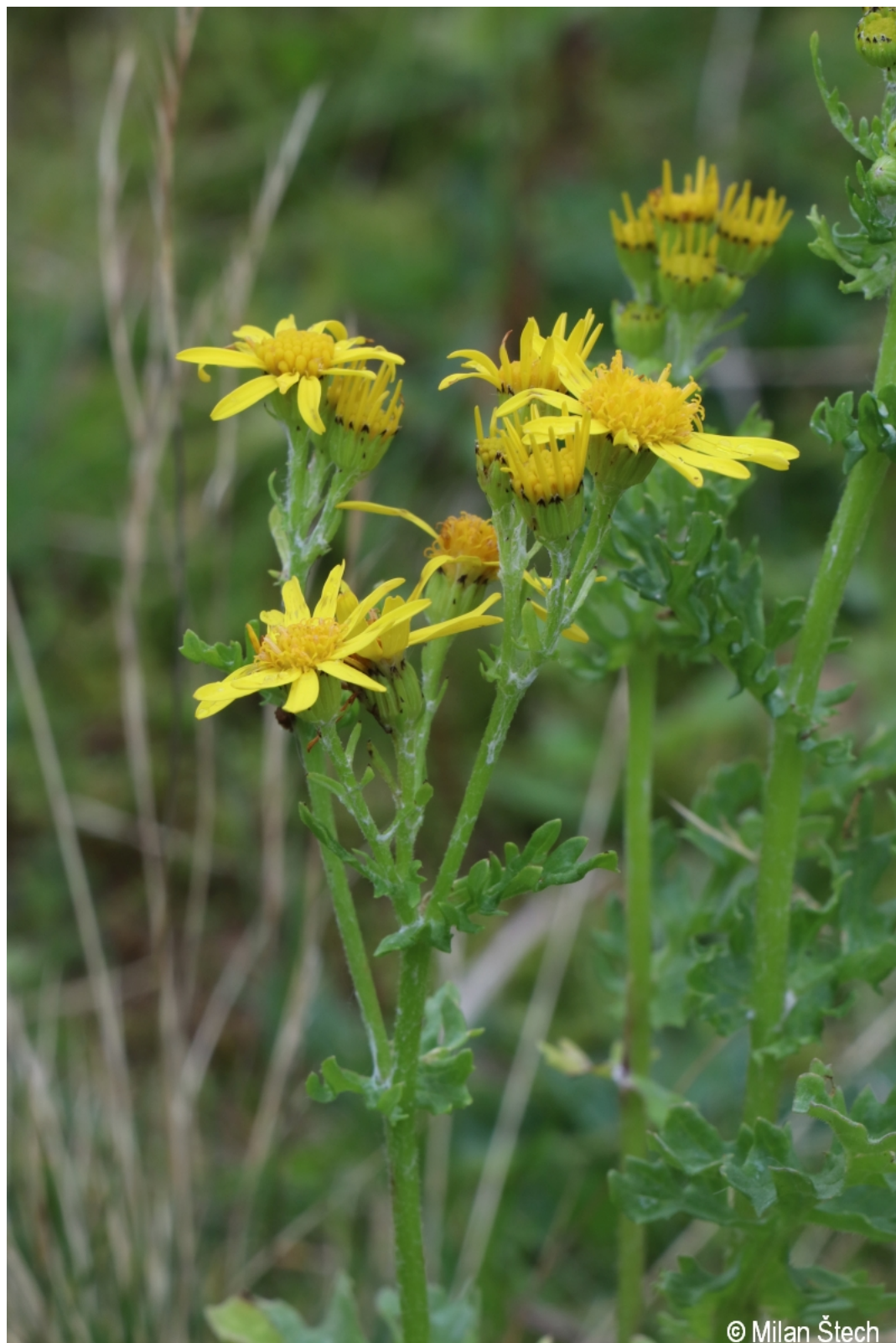
Senecio jacobaea – Milan Štech – Velký Javor.