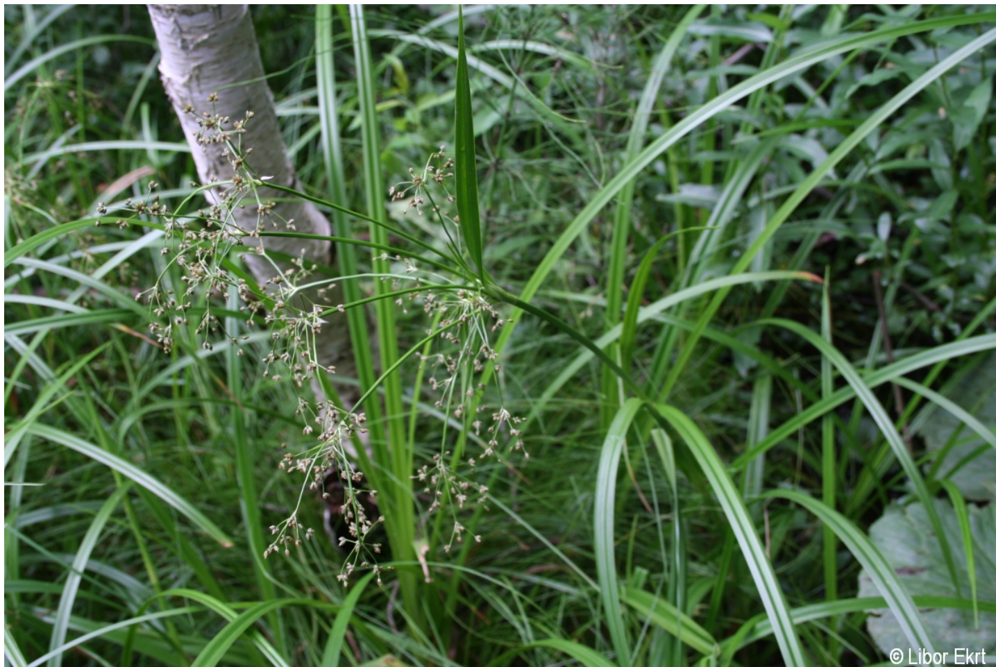
Scirpus sylvaticus – Libor Ekrť – Prášily, Slunečná.