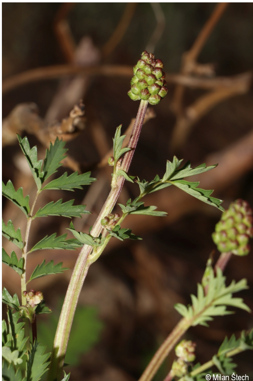
Sanguisorba minor – Milan Štech – Guglöd.