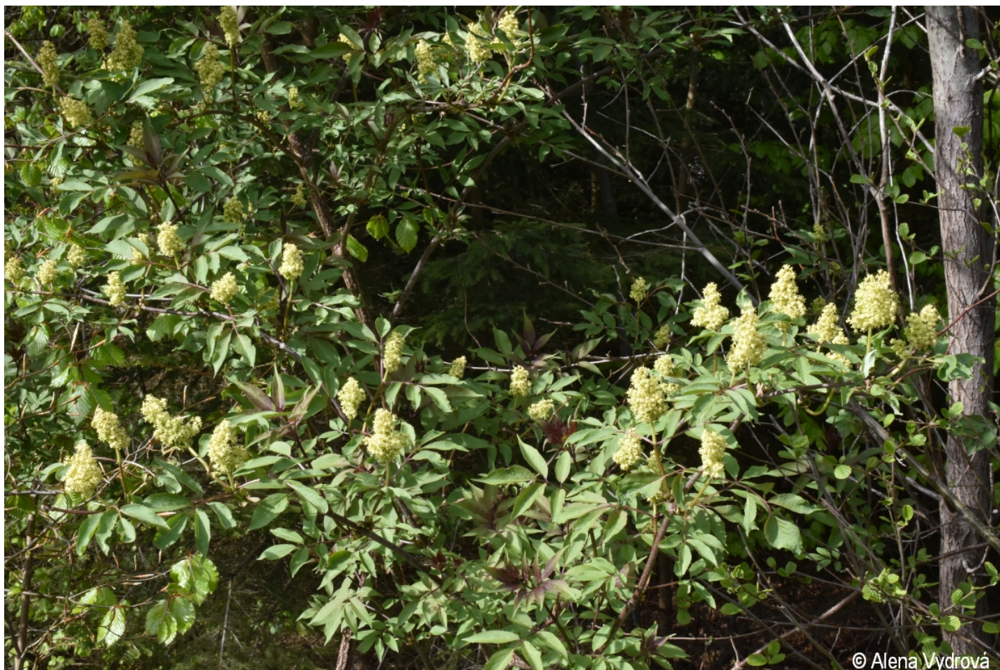
Sambucus racemosa – Alena Vydrová – Frymburk, Kaliště.