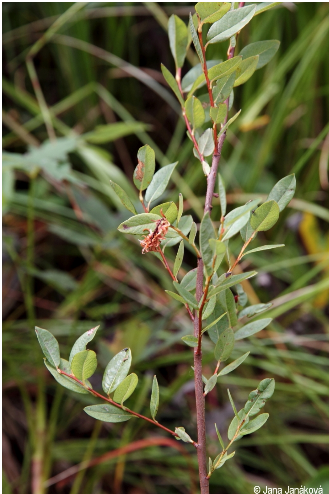
Salix myrtilloides – Jana Janáková – Chlum.