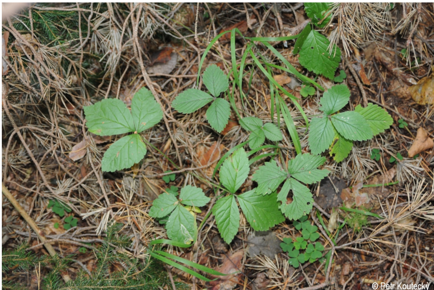
Rubus saxatilis – Petr Koutecký – Chvalšiny.