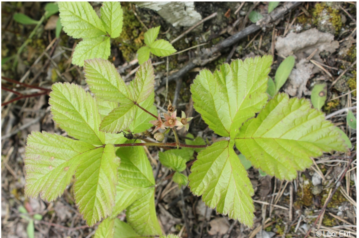
Rubus saxatilis – Libor Ekr – Černá v Pošumaví.