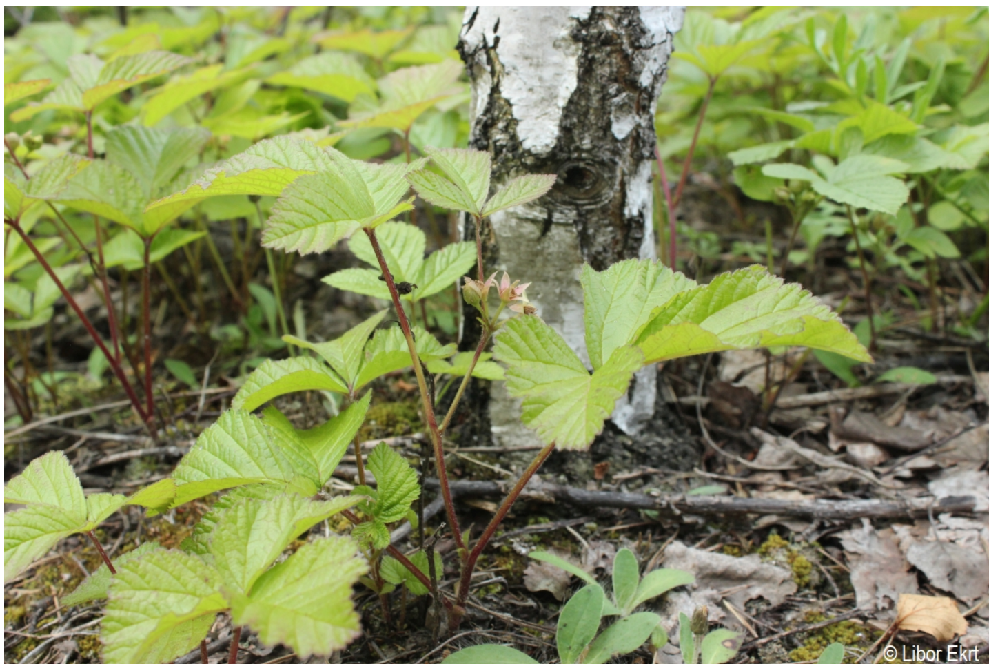
Rubus saxatilis – Libor Ekrť – Černá v Pošumaví.