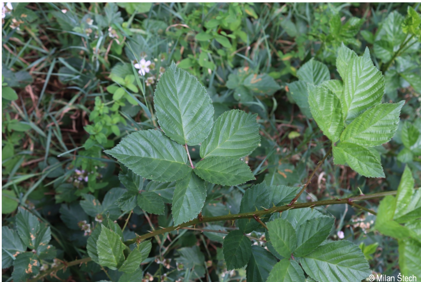
Rubus plicatus – Milan Štech – Debrník.