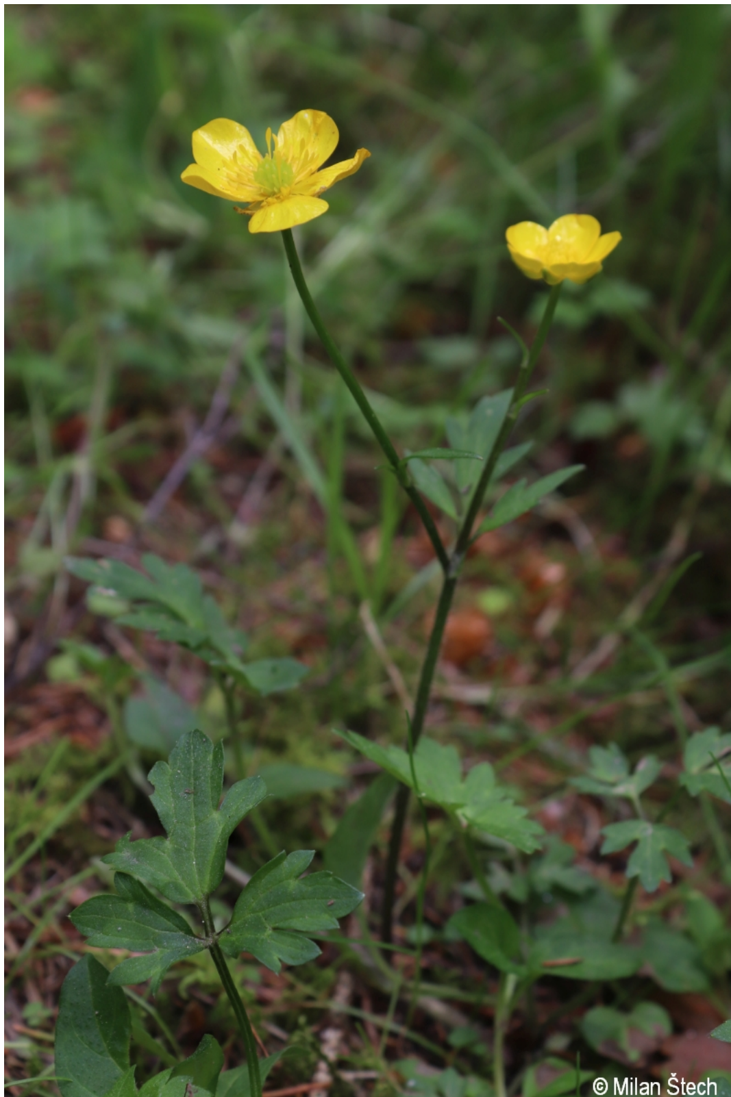
Ranunculus repens – Milan Štech – Rašeliněště Bobovec.