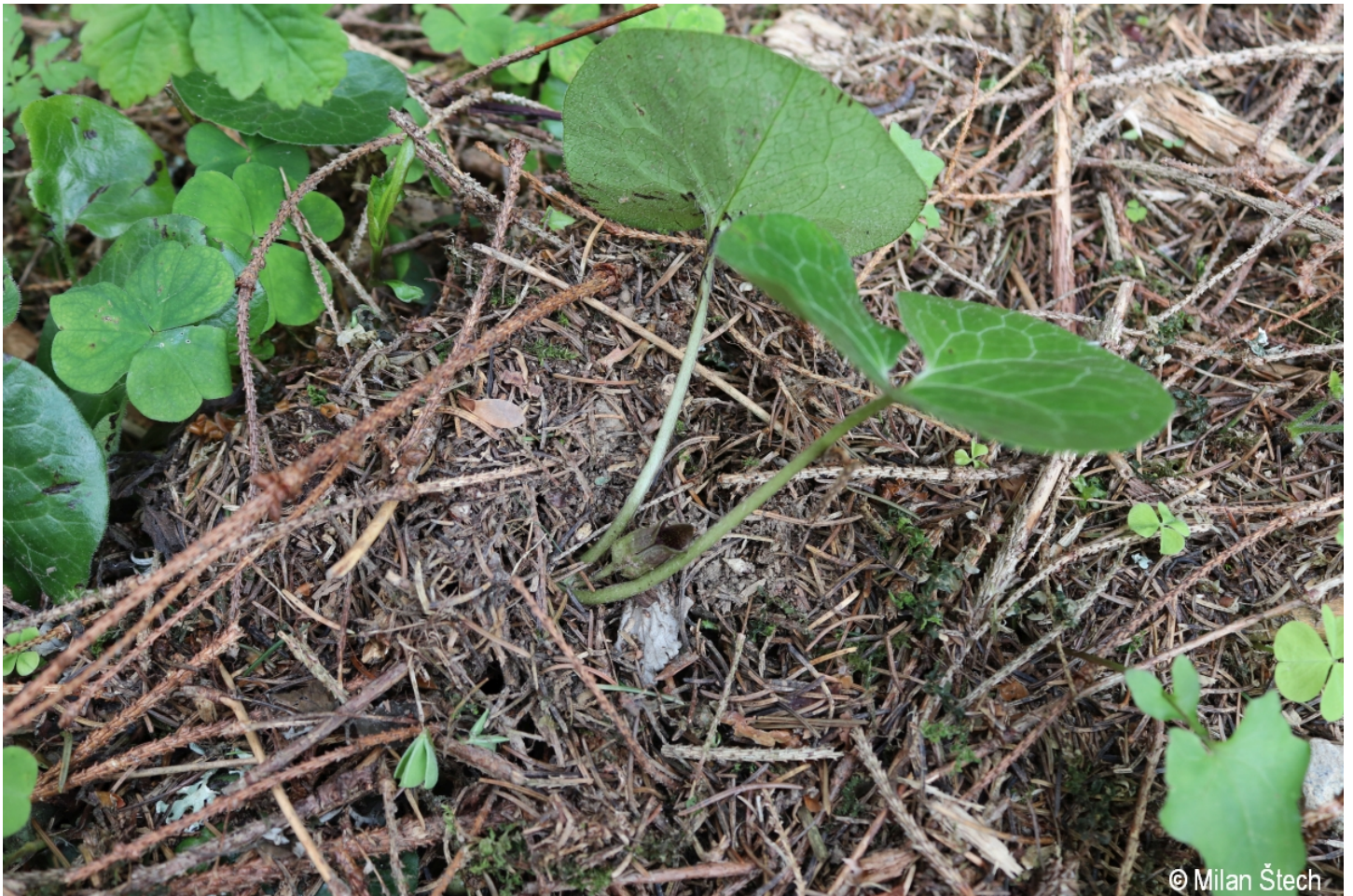
Asarum europaeum – Milan Štech – Olšina, Suchý vrch.