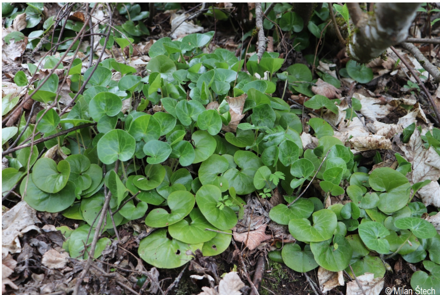
Asarum europaeum – Milan Štech – Dolní Světlé Hory.