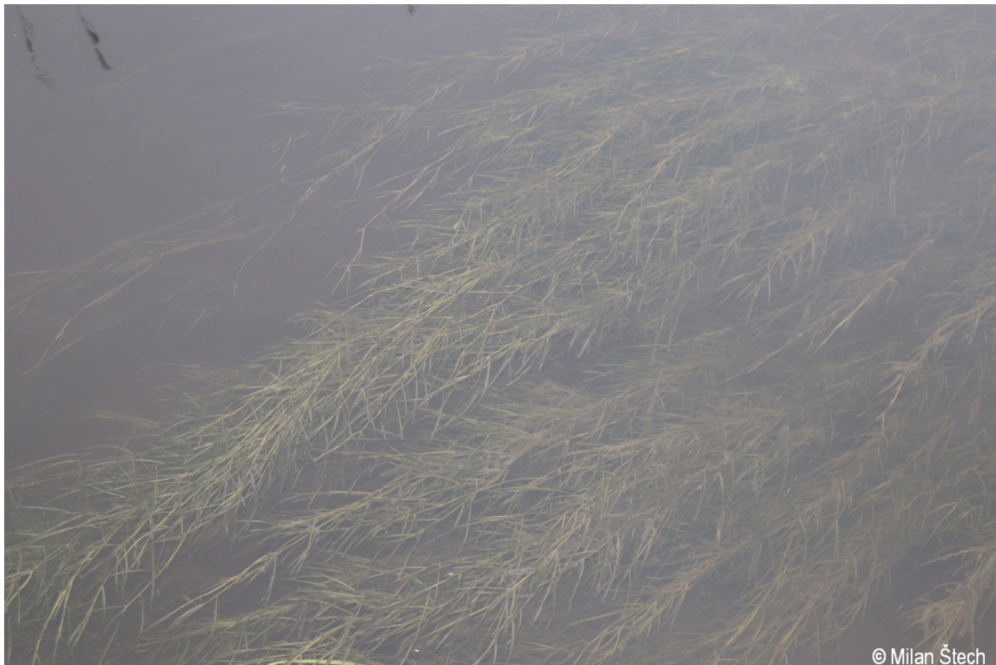
Potamogeton berchtoldii – Milan Štech – Olšina.