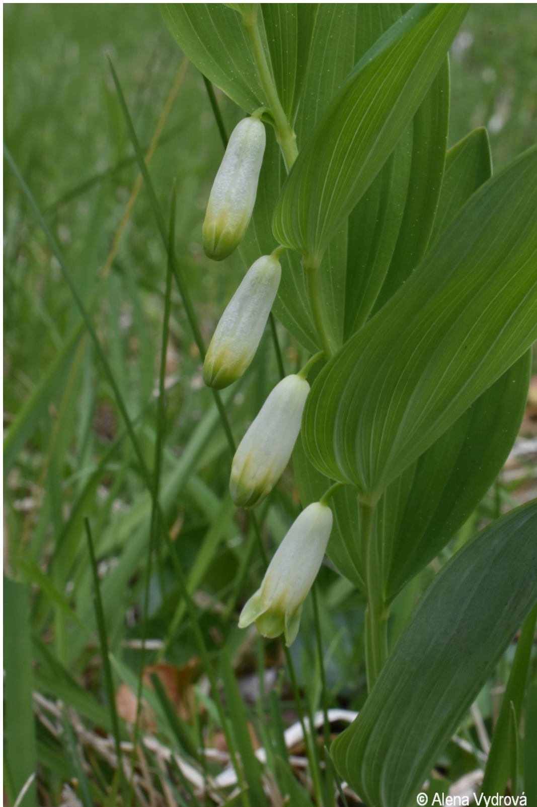
Polygonatum odoratum – Alena Vydrová – Milčice, louky nad Divišovským potokem.