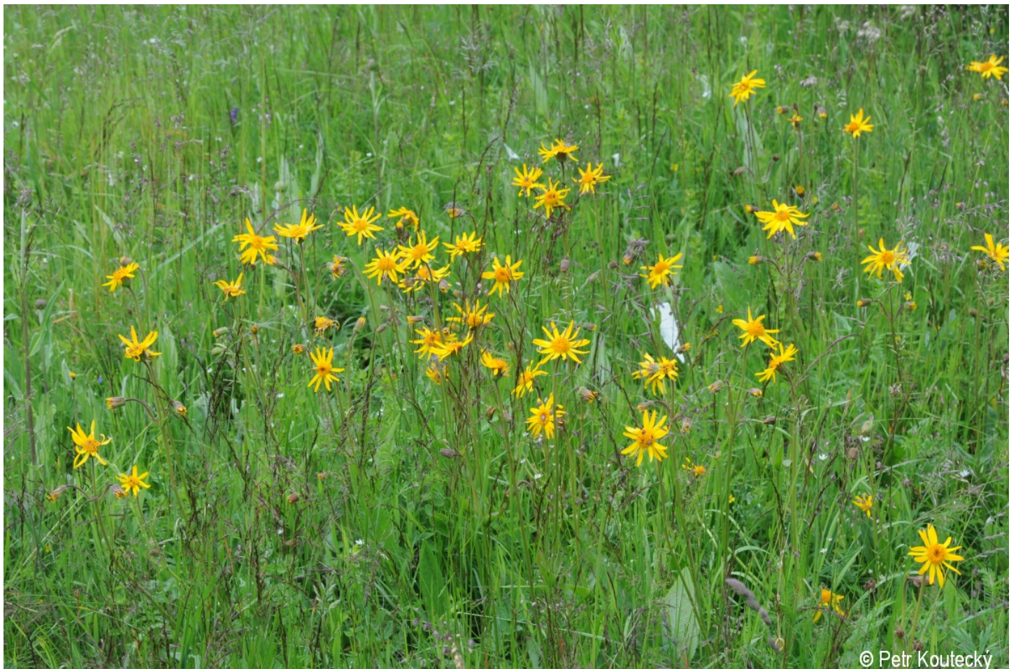
Arnica montana – Petr Koutecký – Knížecí Pláně.