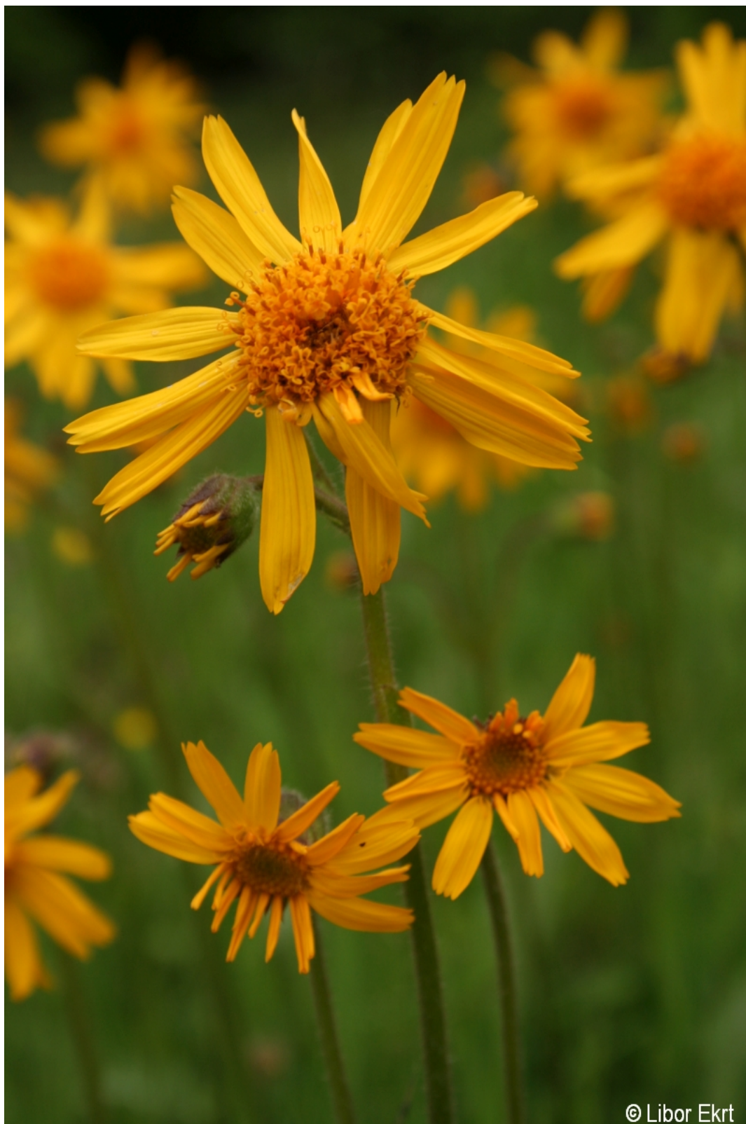
Arnica montana – Libor Ekrt – Borová Lada.