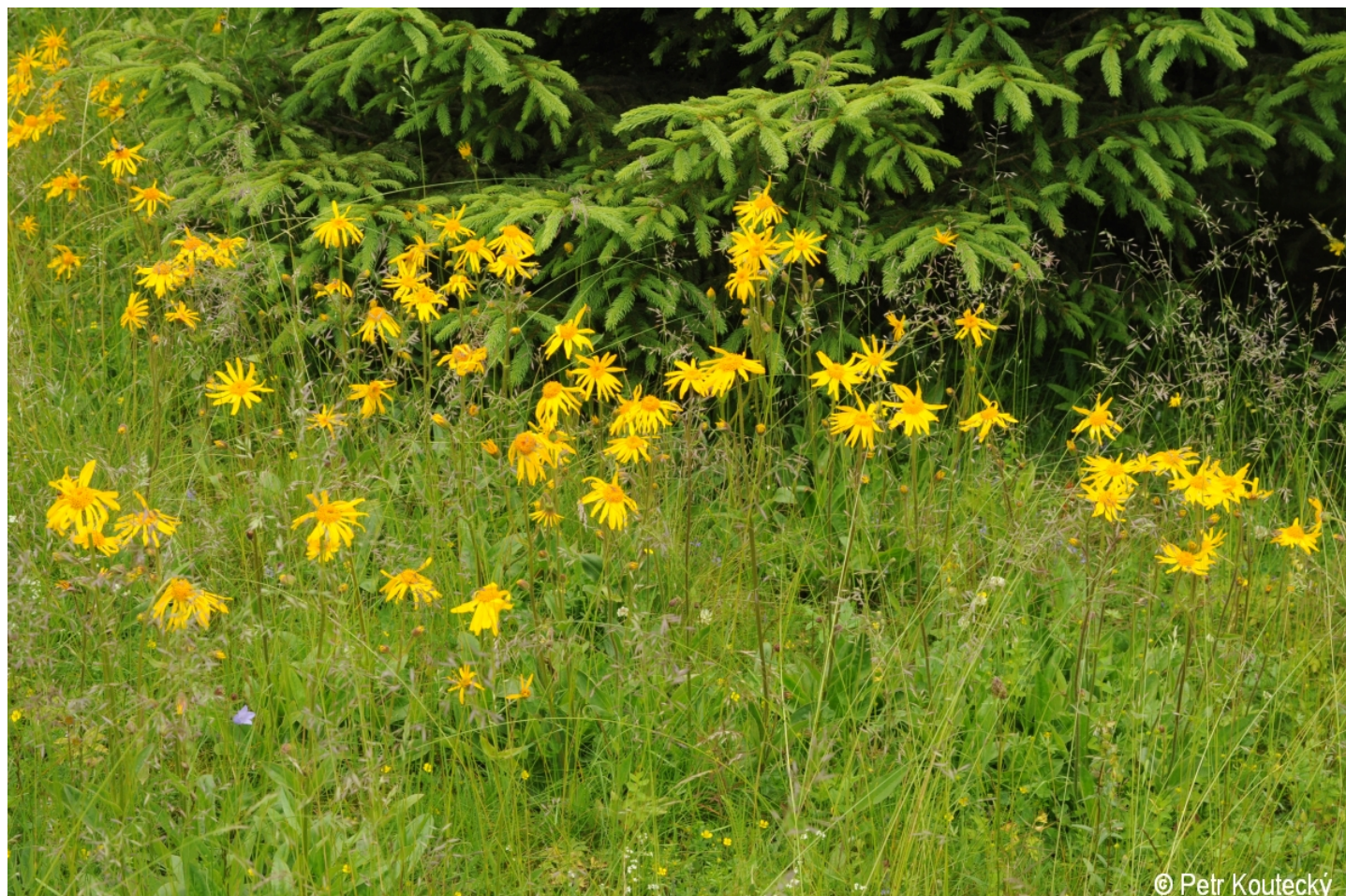
Arnica montana – Petr Koutecký – Strážný, pramen Časté.