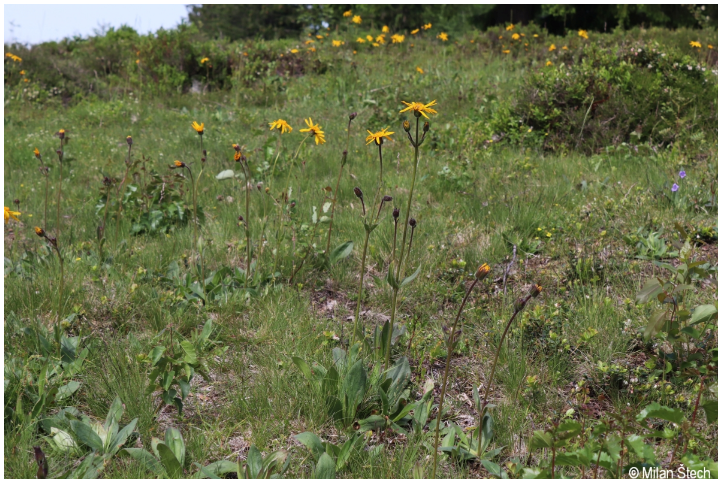
Arnica montana – Milan Štech – Bischofsreut.