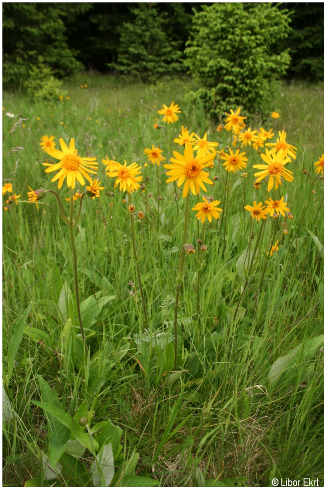
Arnica montana – Libor Ekrť – Borová Lada.