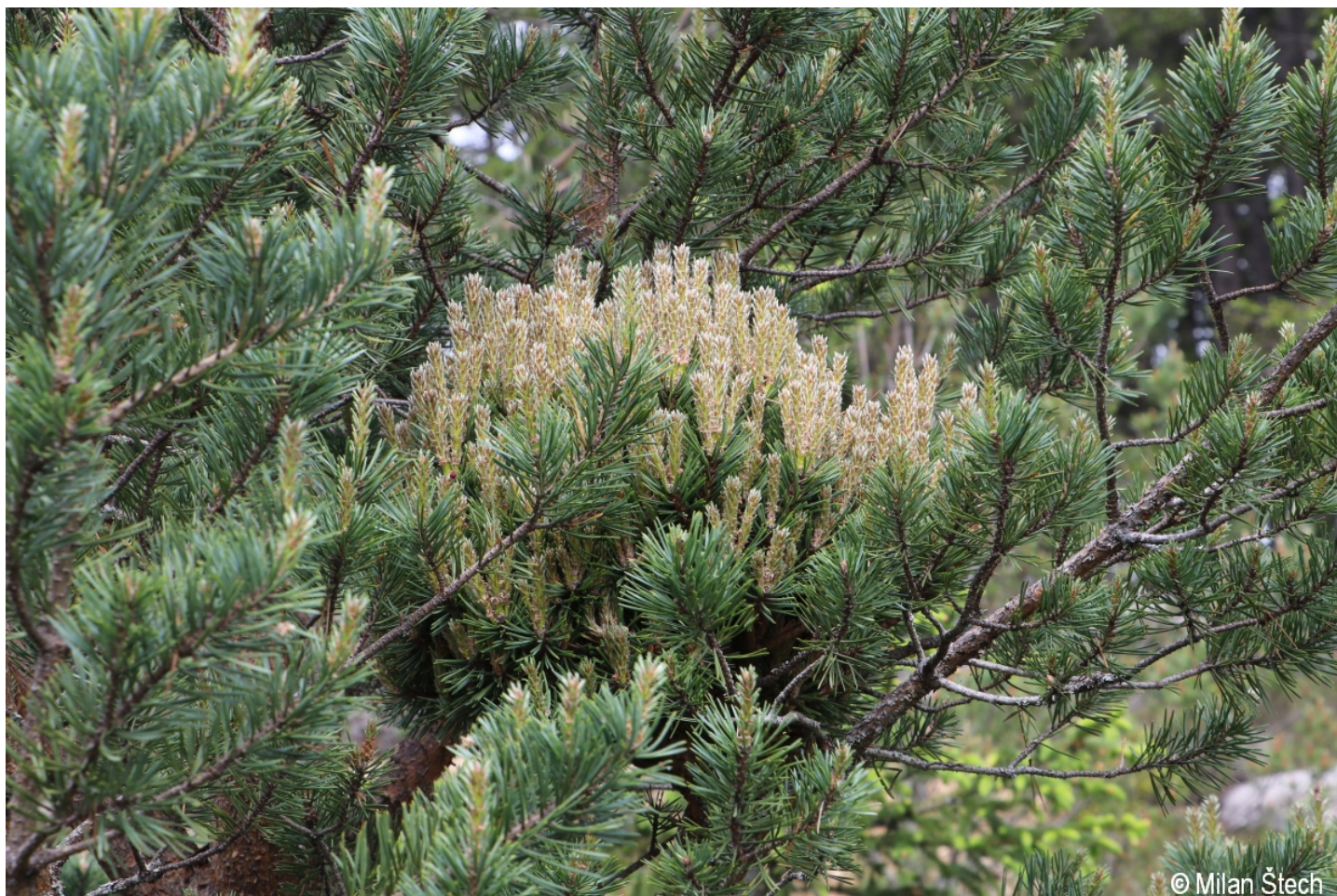
Pinus sylvestris – Milan Štech – Modrava, býv Rybárna.