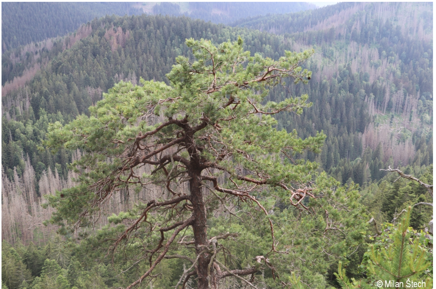
Pinus sylvestris – Milan Štech – Dračí skály.