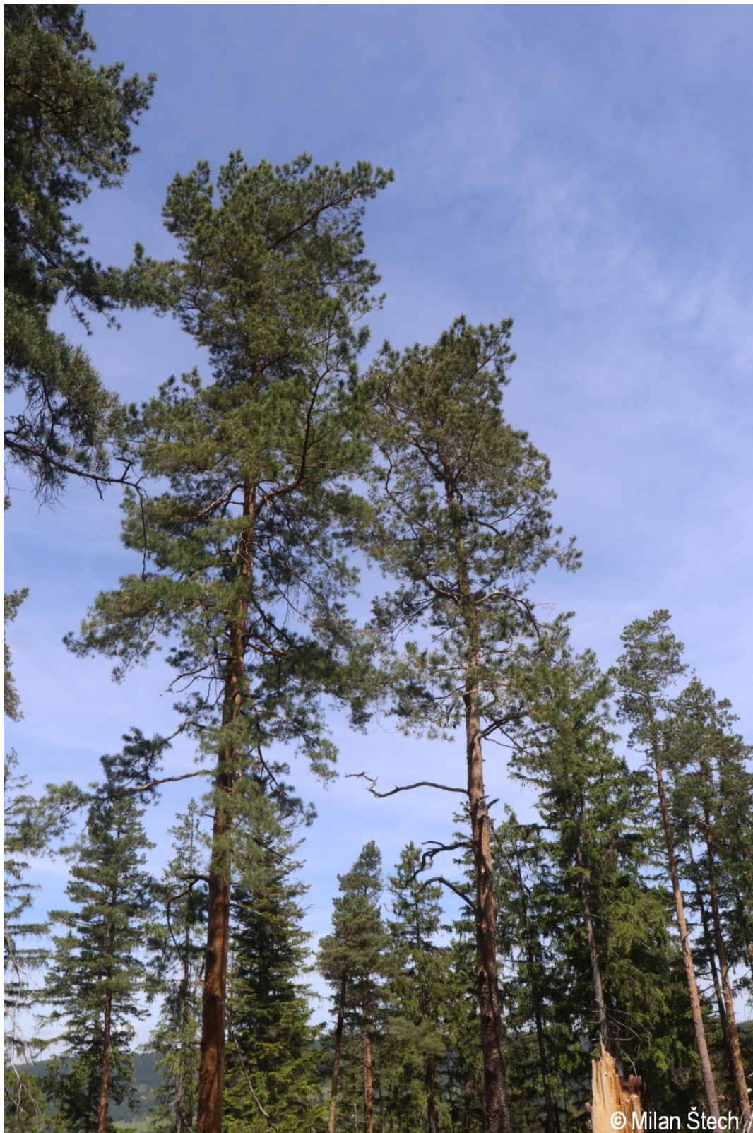
Pinus sylvestris – Milan Štech – Lipno.