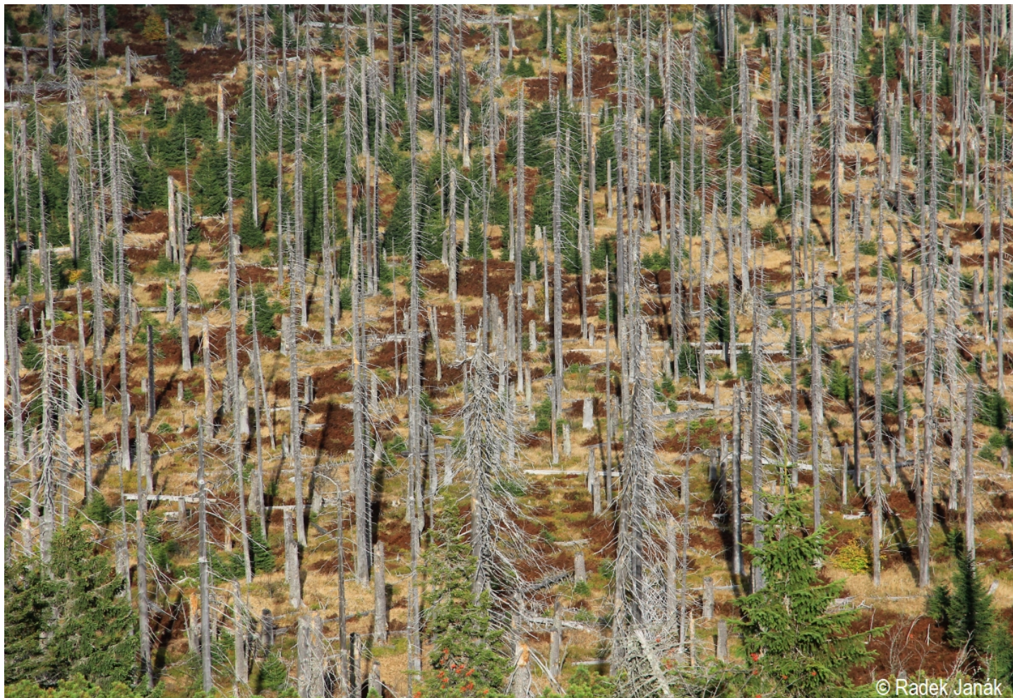
Picea abies – Radek Janák – Lusen.