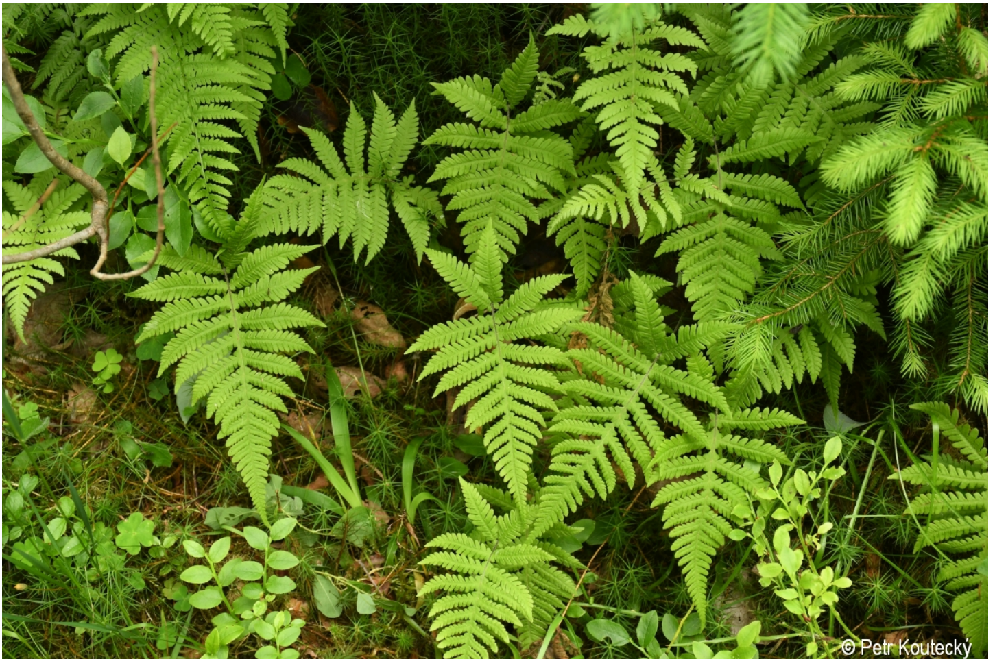
Phegopteris connectilis – Petr Koutecký – Smrčina.