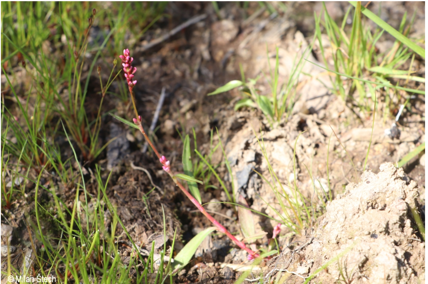
Persicaria minor – Milan Štech – Kamenná Lhota.