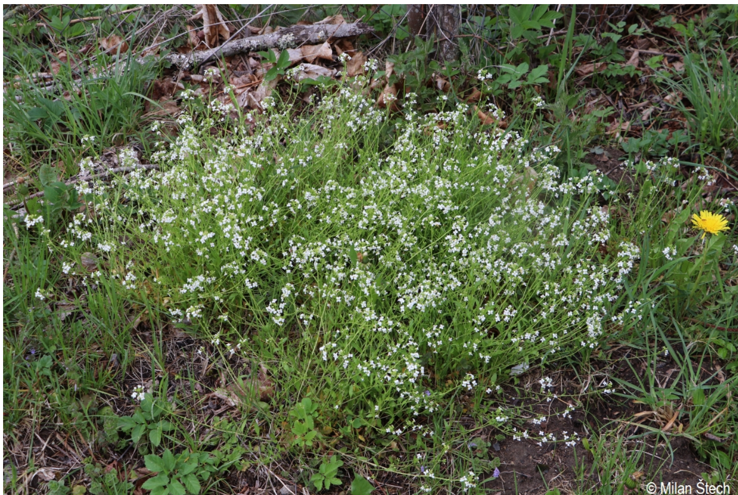
Arabidopsis halleri – Milan Štech – Pěkná.