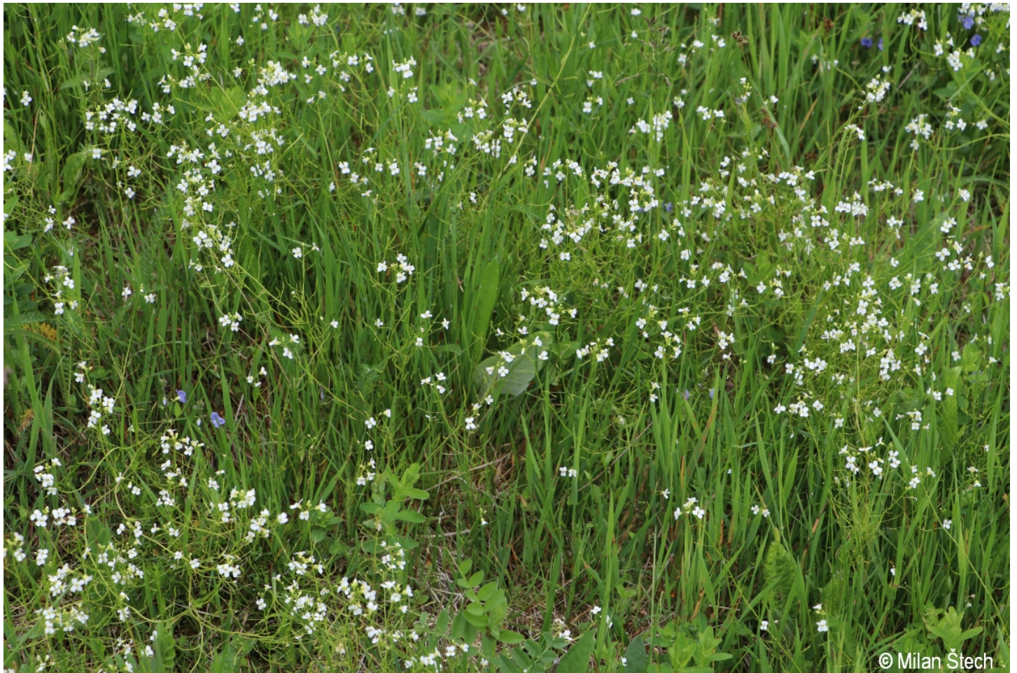
Arabidopsis halleri – Milan Štech – Červený potok.