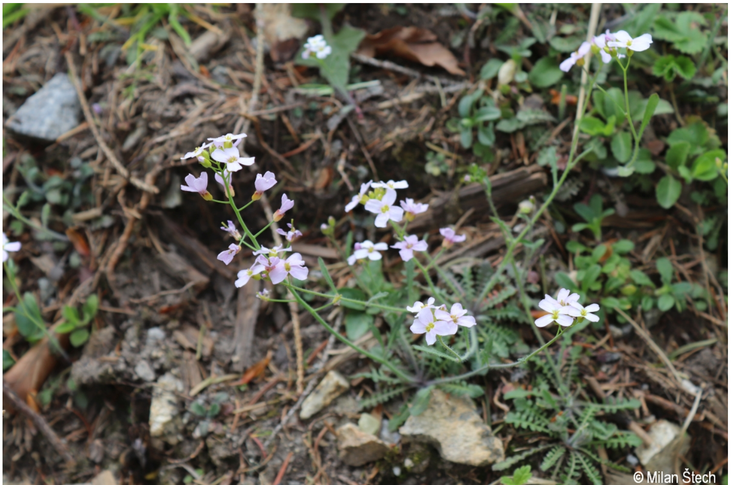
Arabidopsis arenosa – Milan Štech – Jelení.