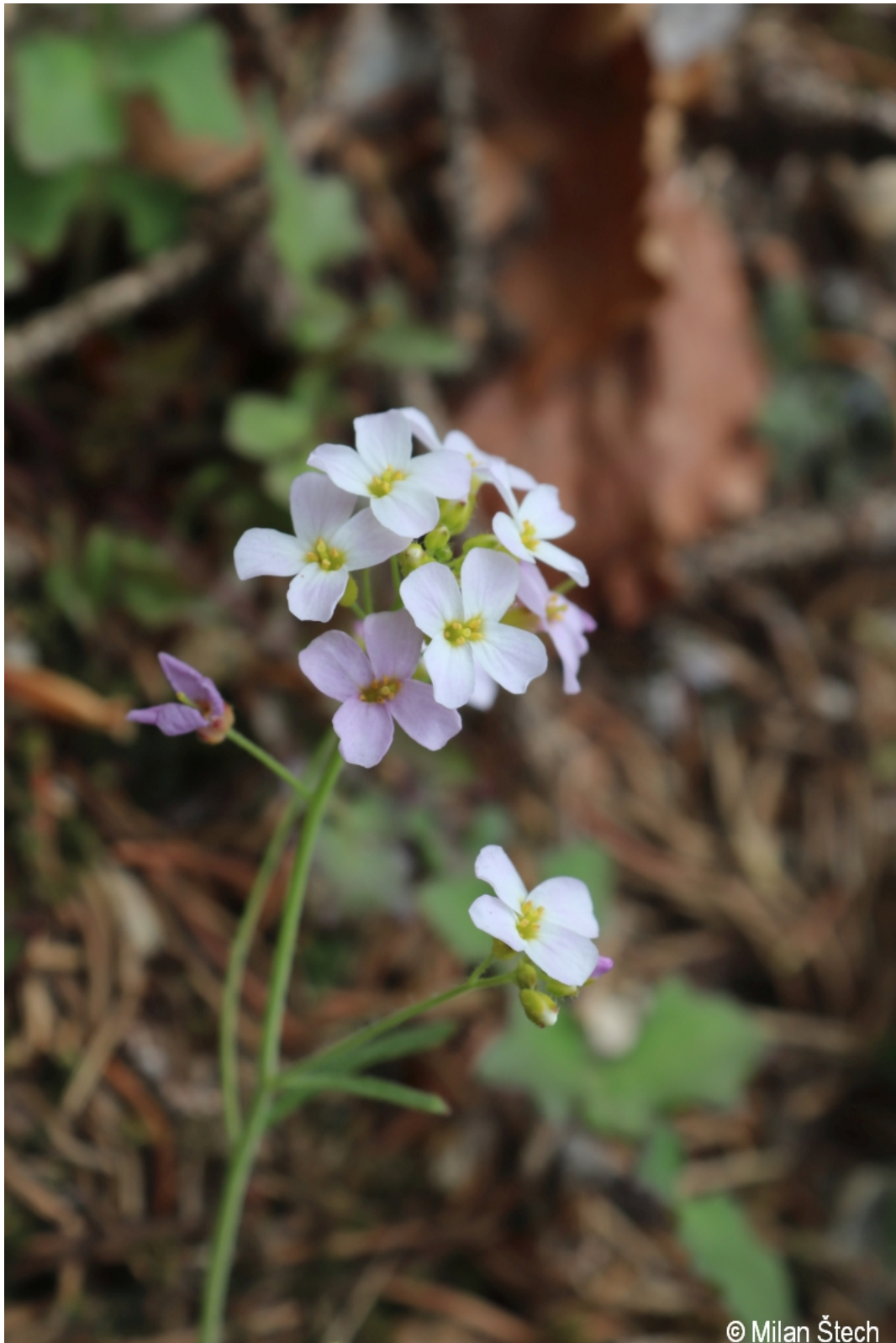
Arabidopsis arenosa – Milan Štech – Jelení.