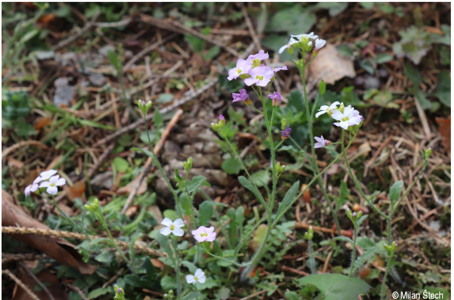
Arabidopsis arenosa – Milan Štech – Jelení.