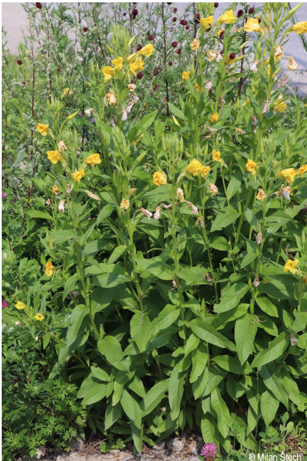
Oenothera biennis – Milan Štech – Lenora.