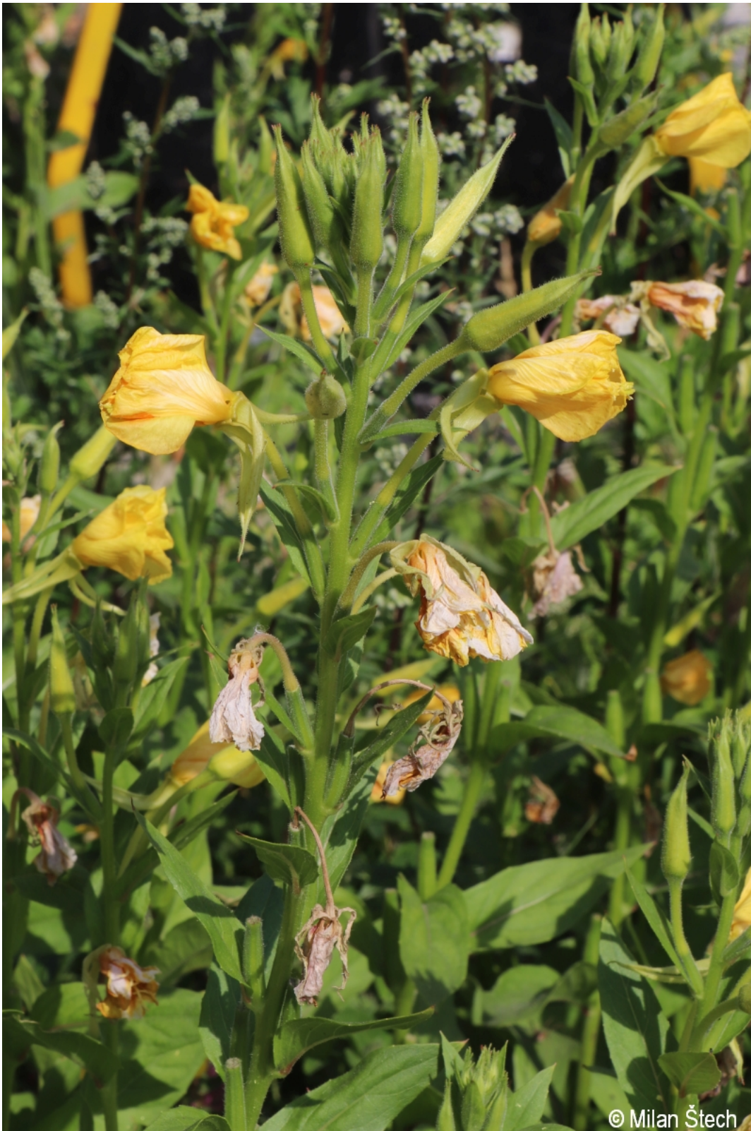
Oenothera biennis – Milan Štech – Lenora.